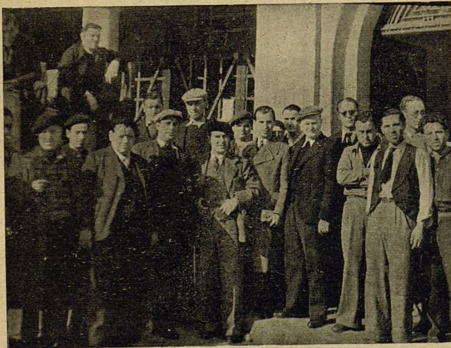
Camarades de la Federació francesa de l'Edificació, portadors de gran quantitat de robes i queviures per als nostres combatents, acompanyats dels representants del Secretariat i de la Federació de l'Edificació U.G.T.