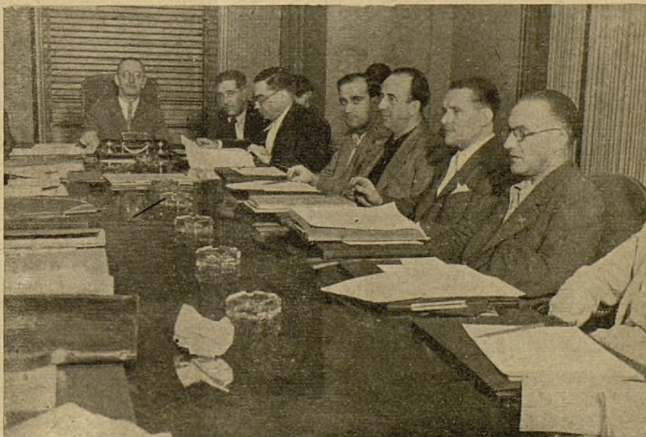
Representants de la U.G.T. i P.S.U. al Consell d'Economia de Catalunya

Si s'estudien amb atenció els dos arguments més forts del requeriment cooperatista que més amunt hem exposat, veurem de seguida que per a un marxista no tenen