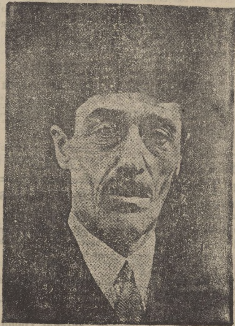
El ilustre aristócrata español duque de Alba

Al mismo tiempo que ocurrían estos sucesos ante el