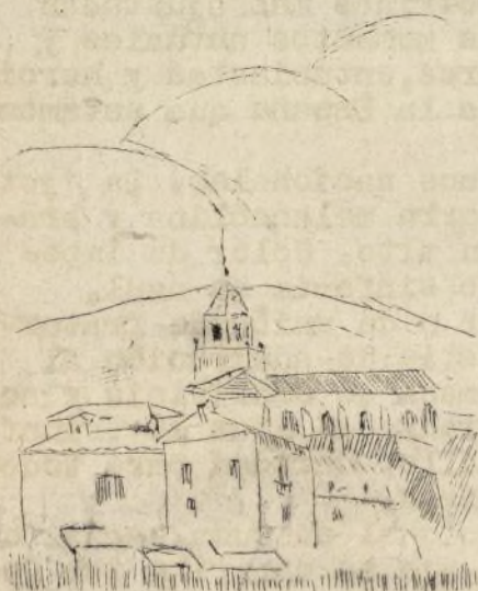
Albarracín: LA CATEDRAL

Los rojos tuvieron una Catedral, la de Sigüenza, que fué el panteón de sus derrotas. Aragón ha tenido su Catedral en Albarracín que ha sido el monumento de su genio y de sus victorias.