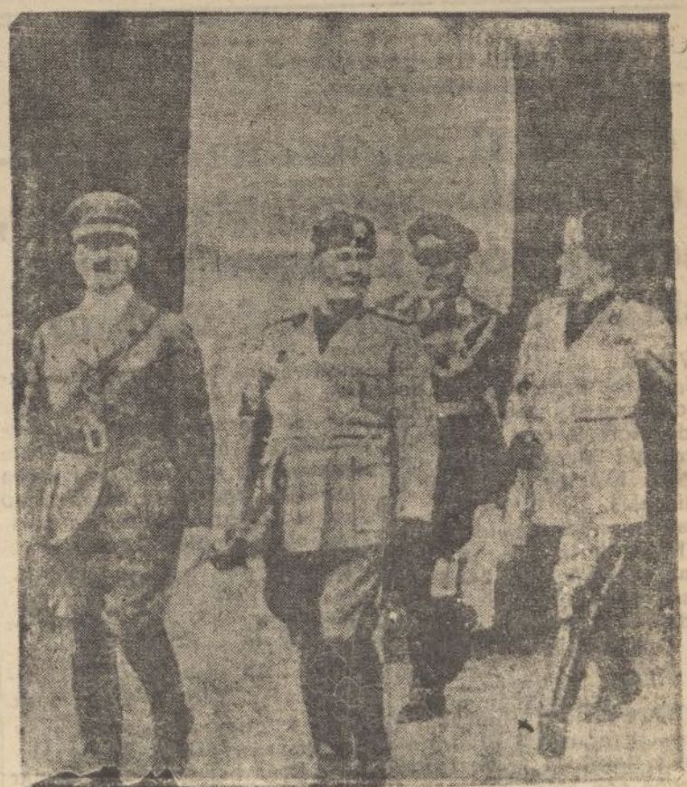
Mussolini, acompañado de Hitler a su llegada a Alemania