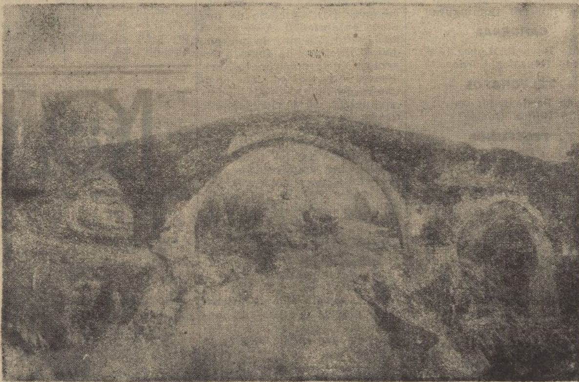
CANGAS DE ONÍS.—Puente romano

bertad religiosa que no está vigente más que en el papel.