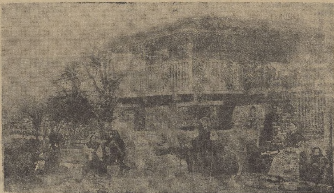
En la quin'ana (tipos y costumbres asturianas)

Entre voladuras e incendios, fueron cayendo las casas de vecindad y los bellos edificios públicos. Montones de escombros y algunos muros ennegrecidos es todo lo que queda del Ayuntamiento, del Juzgado, de la estación del tranvía de Covadonga, del Hotel Asturias y de la casa donde estaba instalado el comercio de tejidos más importante de la comarca