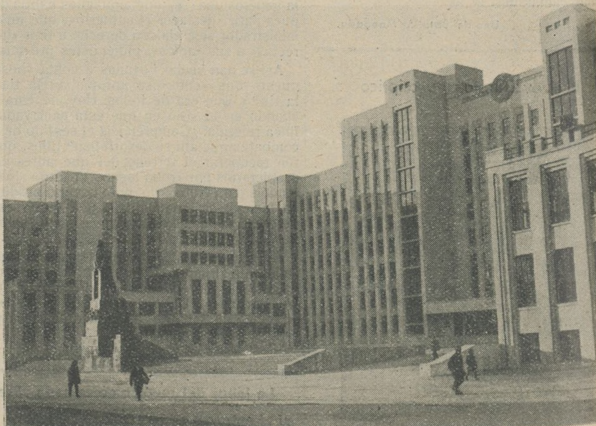
Nueva casa del Gobierno en una de las Repúblicas que componen la U. R. S. S.

En una palabra, lo que os pedimos es colaboración, compenetración, mutua, inteligencia, y de esa manera, unidas nuestras voluntades y nuestros esfuerzos, dar el rendimiento que de nosotros necesita nuestro país.