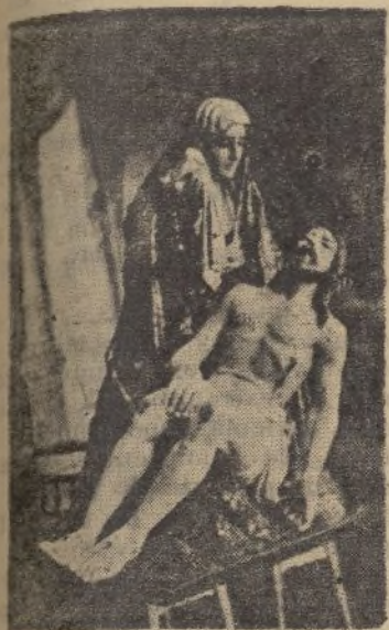
La bella escultura de la nueva Virgen

Pasáronse las flores del verano, El otoño pasó con sus racimos, Paso el invierno con sus nieves cano.