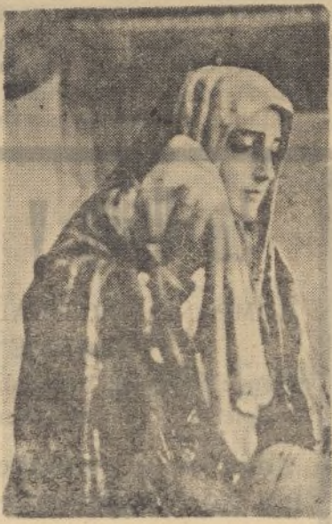
El perfil de soberana belleza de la Virgen