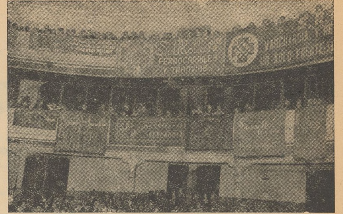
Una vista de la sala, cubierta de transparentes, en el acto pro Congreso Nacional de la Solidaridad.

El arte de vivir, entendiéndolo el fascismo de esta manera: Explotación y ventajita por su casta y en favor de su casta. Perjuicios y dolores para el pueblo; por eso ellos, ni querían ni comprendían que la República favoreciera cultural y también económi-