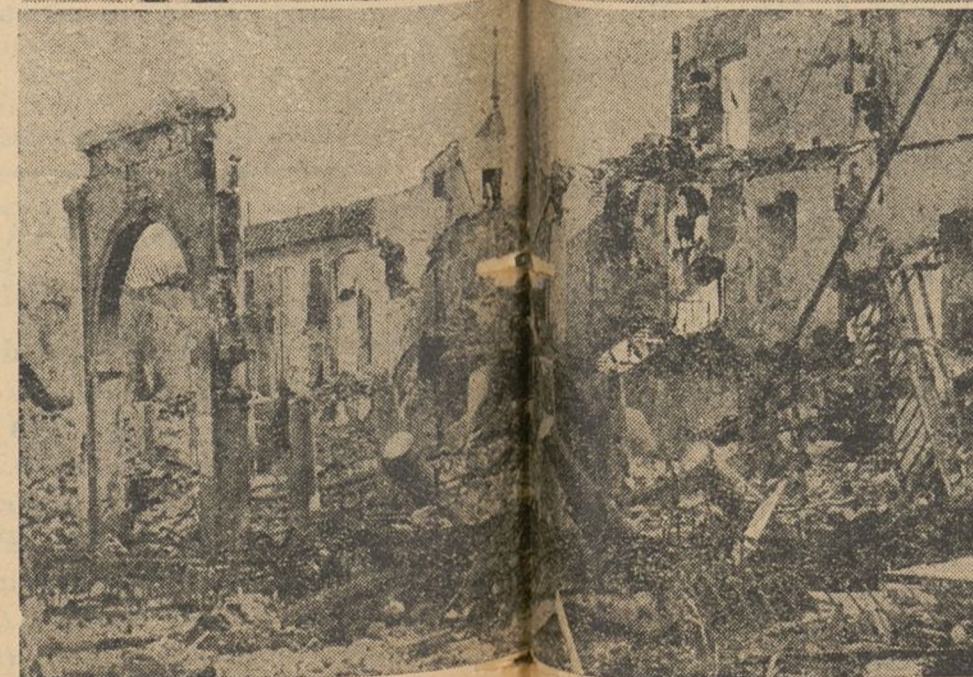
Represión. Casas y pueblos arrasados por las bombas asesinas; terror, hambre y miseria. Estas son las etapas que los invasores ofrecen en su colección de crímenes y barbarie.