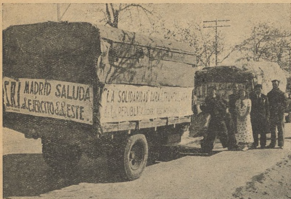
Camiones cargados con prendas y artículos que el S. R. I. envía a las fuerzas del Este, esperando la orden de salida.

dible obligación de señalar a cada uno su puesto. Hay que dirigirse a los Comités de Vecinos y pedirles que en todas las casas, sin excepción, se haga una labor revisora para vigilar quién es el que produce para la guerra y quién vive a espaldas de ella.