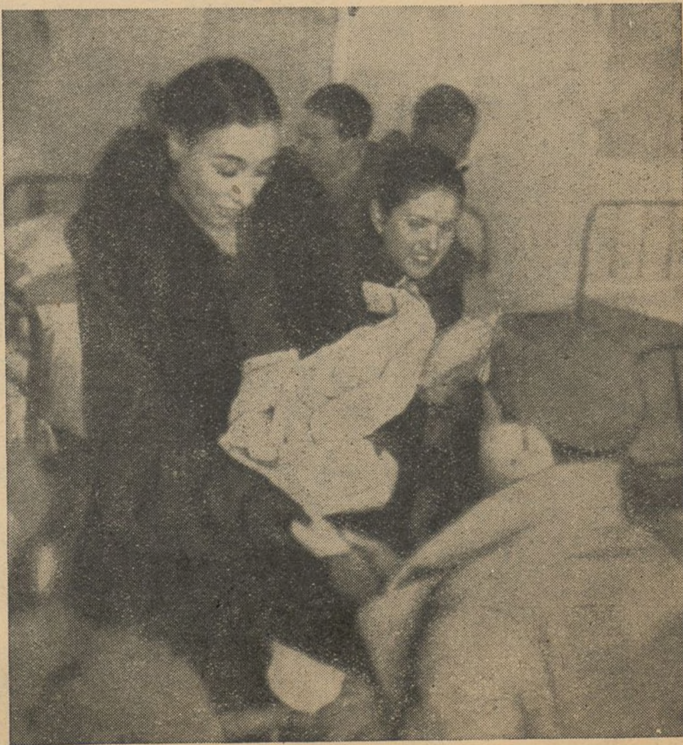
El S. R. I. lleva el calor de la Solidaridad a los heridos de guerra

150 Brigada Mixta.-Blón. C., 3.ª Compañía.-Estafeta Militar 19 de Madrid.