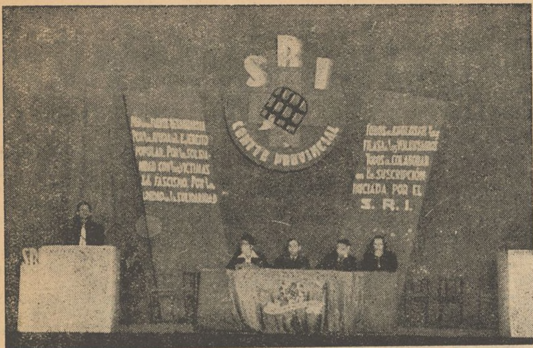
Presidencia del acto celebrado en el Pardiñas, pro Congreso Nacional de la Solidaridad.