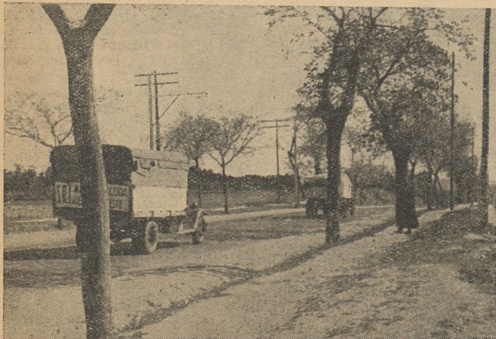
Salida de los camiones que, como solidaridad del pueblo madrileño, a enviado el S. R. I. a los heroicos combatientes del Este.

Como final del acto, se leyeron acuerdos y telegramas de adhesión al Gobierno, al Ejército y al Frente Popular, guardándose un minuto de silencio en recuerdo de los caídos en la lucha por la independencia de España.