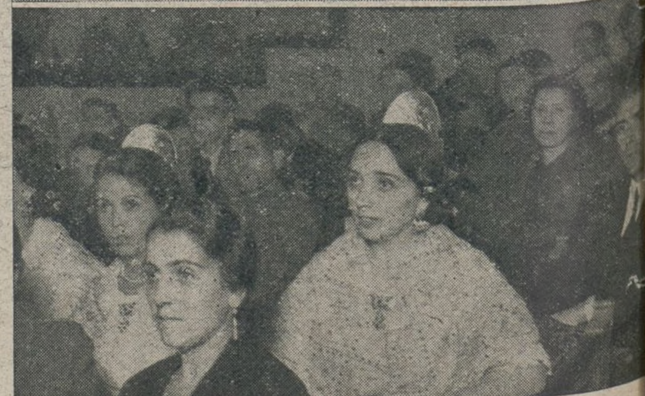
Varias fases de la Conferencia Nacional de la Solidaridad