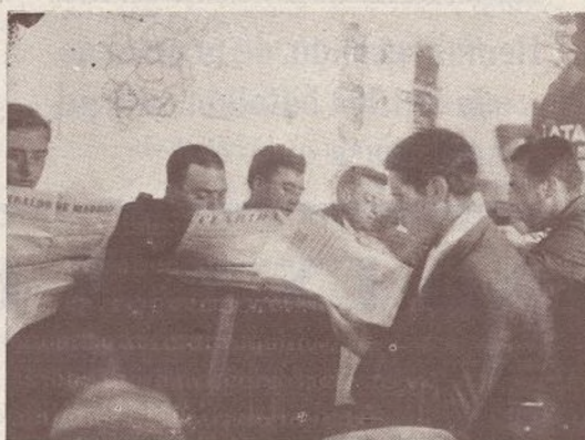
CULTURA: Nuestros combatientes acogen el Hogar con grandes deseos de aprender.

Un ejemplo a seguir nos brinda la tercera compañía del 103 batallón. Los camaradas que pertenecen a esta compañía, y que dejaron la hoz para empuñar el fusil en los primeros días en que el enemigo trataba de rom-