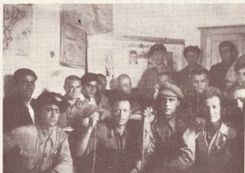
Uno de los plenes de Comisarios, donde nuestros camaradas discuten planes que pronto serán realidades.

Una de las causas más frecuentes de partos prematuros y de hijos enfermos, y por consecuencia en contra de la Eugenesia, es la «sífilis», enfermedad perfectamente curable si se hace un tratamiento bien dirigido y suficiente. Digo esto por ser muy común en los enfermos el abandonar el tratamiento en cuanto desaparecen los síntomas que tenían, error crasísimo, porque al contraer