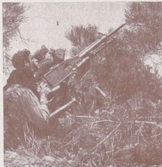
UN PULSO FIRME PARA ABATIR A LA AVIACION DEL CRIMEN