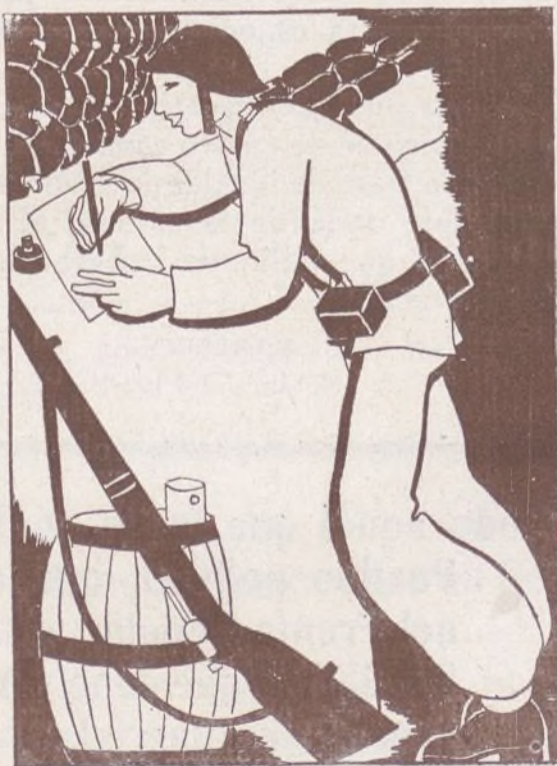
VÍCTOR PAJARES Soldado del 104 Batallón