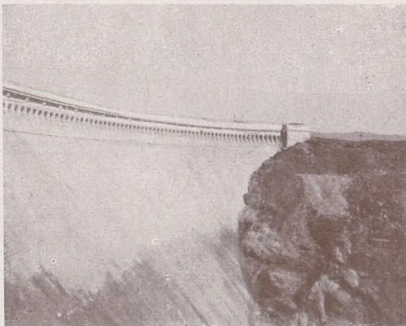
LA PRESA. HOY DEFENDIDA POR SOLDADOS DE NUESTRA BRIGADA

En lo que fué iglesia se reunió la población, siendo de notar la presencia de gran cantidad de mujeres y niños.