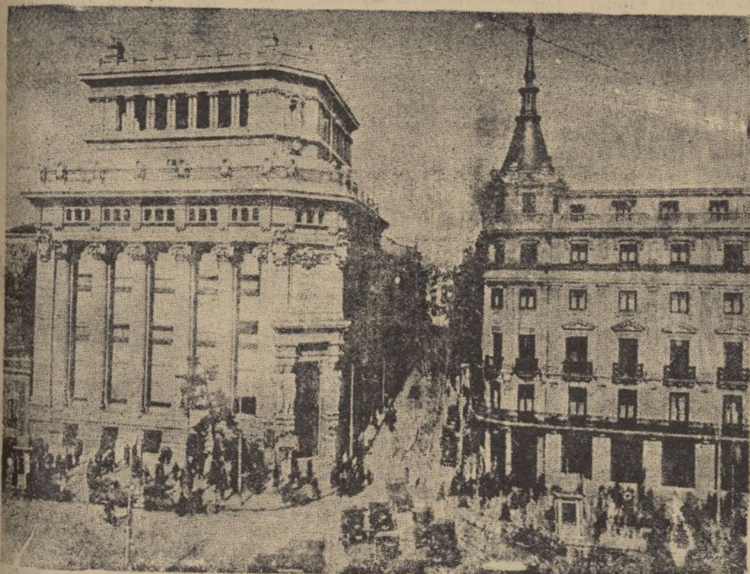
MADRID.—Bancos de Urquijo y Central. Entre ambos la calle del Barquillo

rrados, esperan siempre la detención, el asalto, la muerte. Unos meses hubo al comienzo del año, que los salvados milo grosamente de aquellas matanzas, pasadas, respiraron con más tranquilidad. Se les habló de un solo gobierno, de una autoridad única, de una sola ley, de un solo mando. Se les convenció en fin de que los hombres que decían luchar por una democracia, habían decidido abrazar un totalitarismo. Tan-