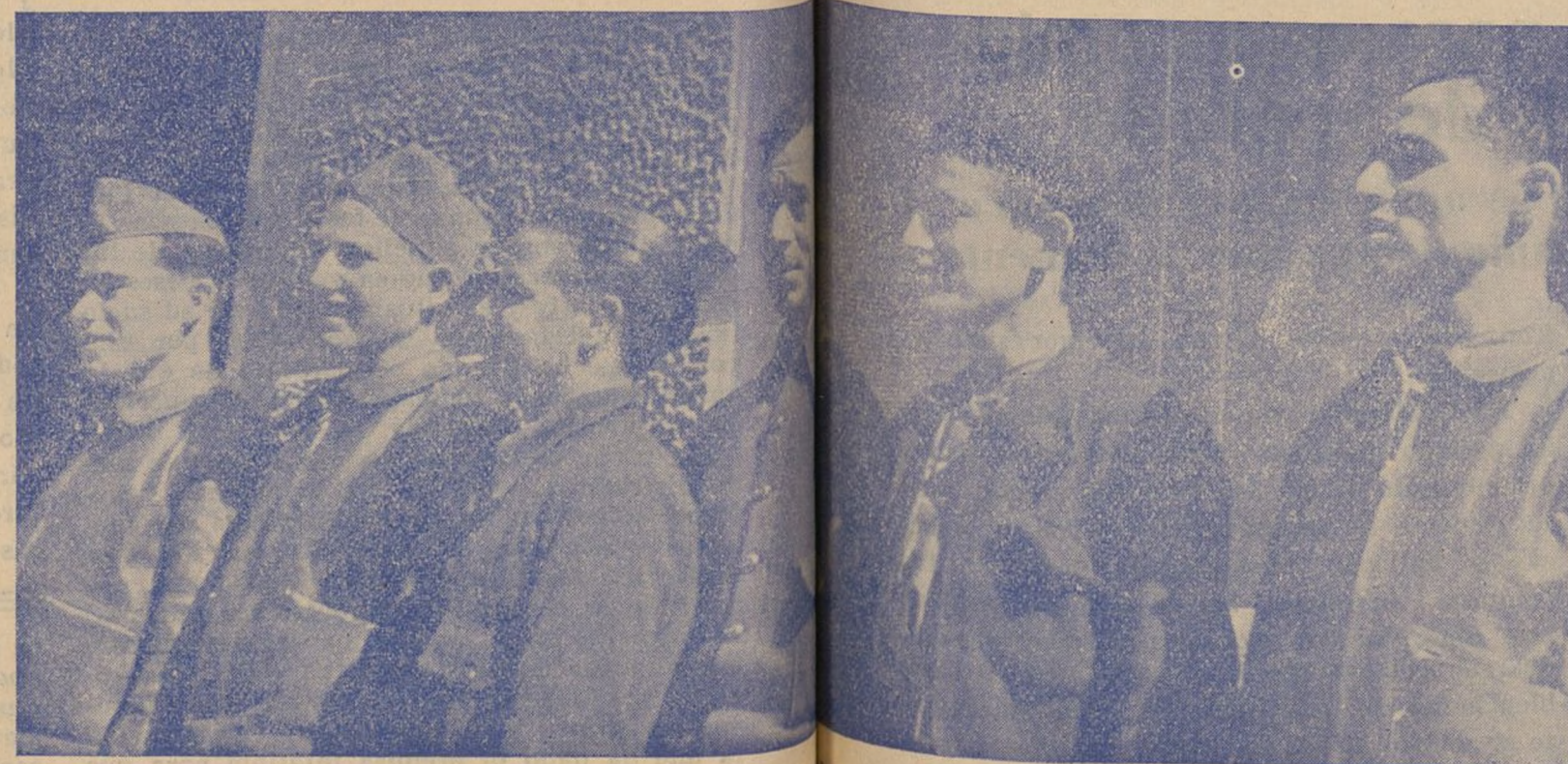
Combatientes de la 16 Brigada Mixta, que, por su gran heroísmo han recibido el más caluroso elogio de nuestros mandos

Combatientes de los frentes, hay que ir con coraje y de- nuedo. Lo que hemos de conquistar merece todo sa- crificio. Luchamos, sabedlo bien, por que España sea para los españoles. Y lo lograremos. (Palabras del Dr. Negrín)