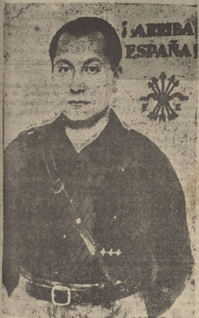
El Ausente inolvidable, creador de Falange, José Antonio Primo de Rivera