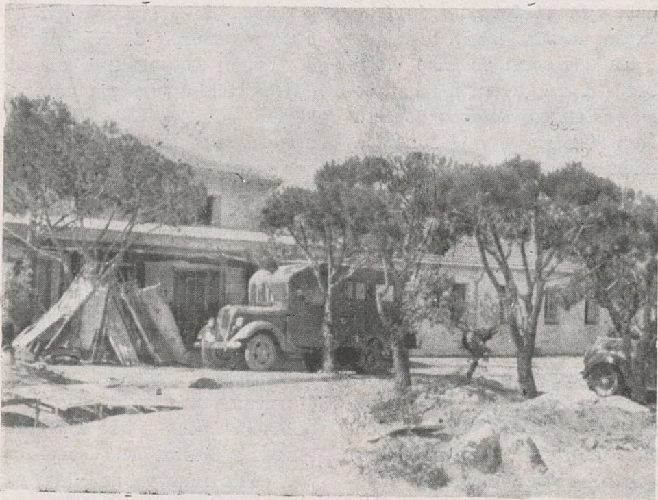
Hospital núm. 2 de la 15 División en la Sierra.

febrero? Aquellas escenas del hospital viven todavía en mi memoria. El excesivo trabajo en la sala de operaciones, donde escasamente podía uno moverse, debido a la acumulación de camaradas heridos, doctores, enfermeras y ayudantes. Luego, dejando la sala de operaciones por unos minutos, encontraba en los corredores, en las escaleras, en el patio, docenas de heridos con vendajes empapados de sangre, esperando el momento de ser operados. Su expresión era terrible para la vista, y, en realidad, se encontraba uno satisfecho de regresar al quirófano, donde siempre había algo que hacer para calmar sus sufrimientos.