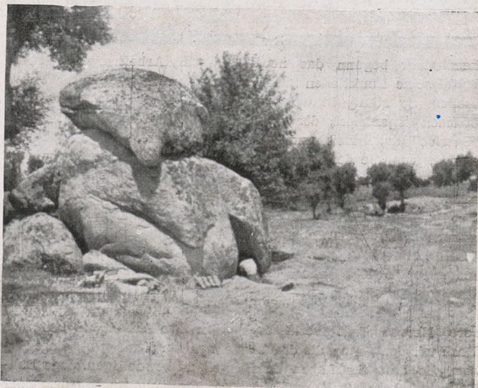
En el Puesto de Ambulancias preparando un refugio.