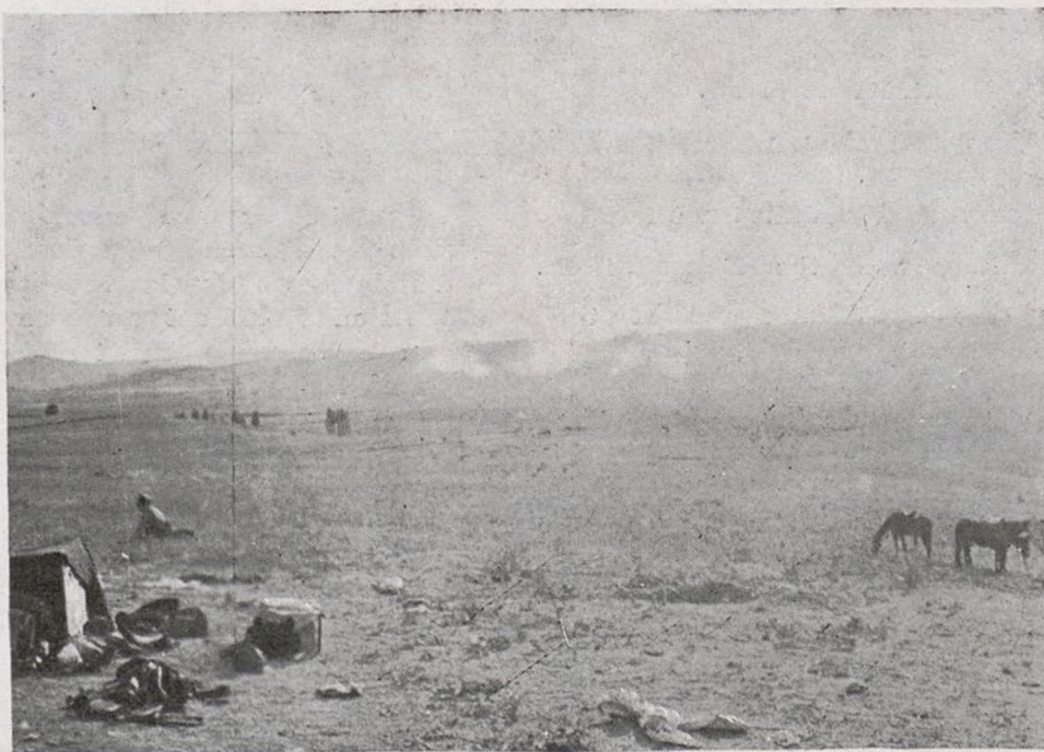
Ataque sobre Villanueva de la Cañada.