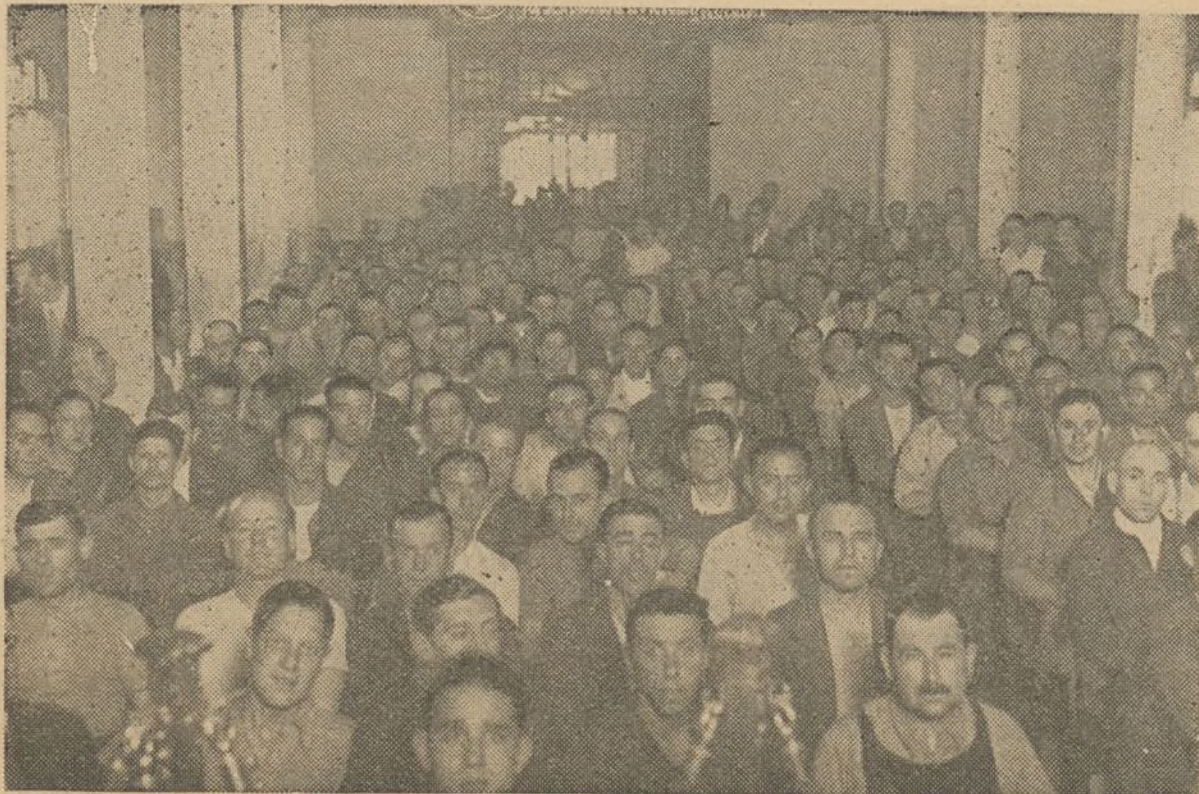
Una vista de la Asamblea de Metalúrgicos.