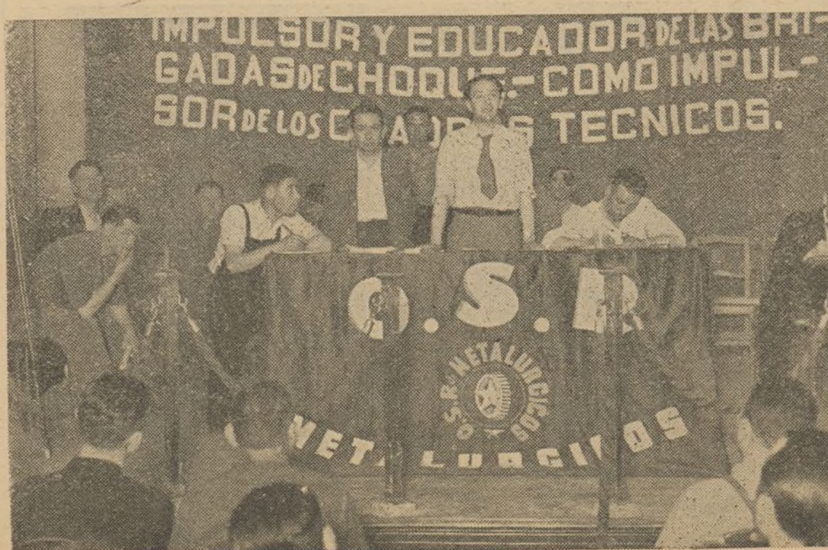
La presidencia de la magnífica Asamblea de metalúrgicos.

¡Atención! Camaradas dirigentes de los Sindicatos, camaradas de los Grupos de O. S. R.: Propagad la capacitación técnica. Pensad en el mañana cercano.