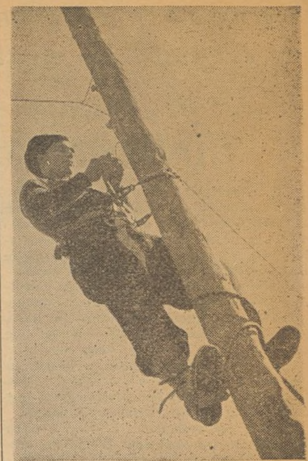
Los obreros telefónicos exponen su vida al reparar averías en pleno campo de lucha.

Hemos de señalar que la actuación rápida y enérgica de la Internacional Comunista es un ejemplo, y cabe esperar que los hombres de la I. S. O. tomarán de él sus buenas cualidades para llevar a la discusión proposiciones concretas de unidad de acción.