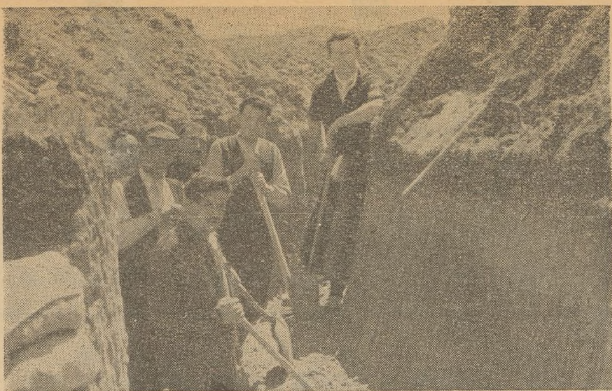
Nuestros heroicos fortificadores hacen para nuestros hombres la pelea más fácil y menos arriesgada.