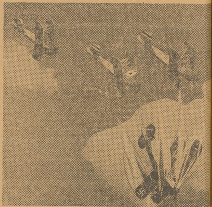
¡Salud a nuestros gloriosos combatientes del aire

(Esto exigen todas las organizaciones antifascistas)