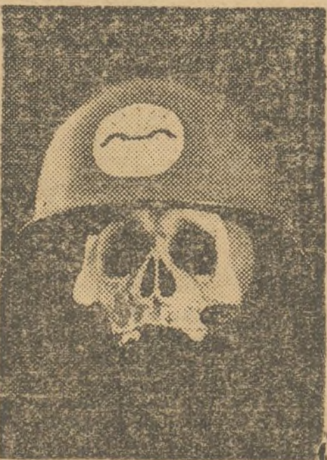
YA LLEGARON LOS SOLDADOS DE MUSSOLINI!

No ignoro que cierta parte de la Policía trabaja en estos momentos