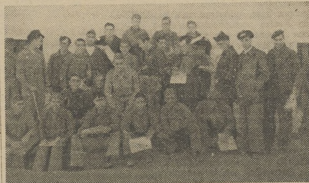
Componentes del Cuerpo de Seguridad quieren mostrar ante el fotógrafo su alegría como partícipes en la defensa de Madrid.

na el contenido de algunas de ellas y dedica algunas páginas para que por medio de la anécdota y las curiosidades se avive el deseo en todos de transformar lo que sirve de altavoz de propaganda en los países fascistas en un cine nacional riente, libre, limpio de las lacras del capitalismo.