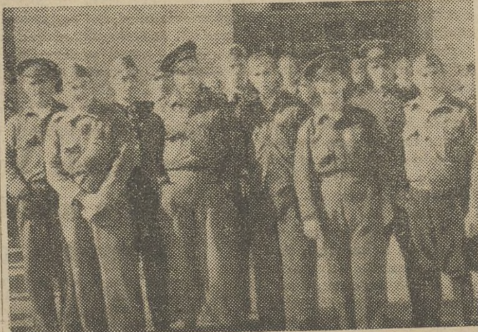
Mandos de la 33 Compañía, que durante algunos meses han estado defendiendo nuestro invencible Madrid, hoy preparados para ocupar otro puesto.