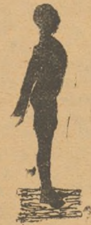
(F. Br. Ar.)

Y al citar algunas escenas de «La última noche», creemos que deben servir de lección a los antifascistas españoles. Así, debemos recoger, de la interesante y bien lograda del tren, el hecho de que el perfecto revolucionario al par que heroico debe ser astuto para conocer y espiar a sus enemigos; se nos debe grabar también en la memoria que el exceso de humanitarismo nos puede conducir a tristes sucesos, como se presenciaban en «La última noche» cuando se respeta la vida del déspota Leontiev, viejo aristócrata, y de la burguesita cursi y enamoradiza, mazapán ante el peligro y sin al-