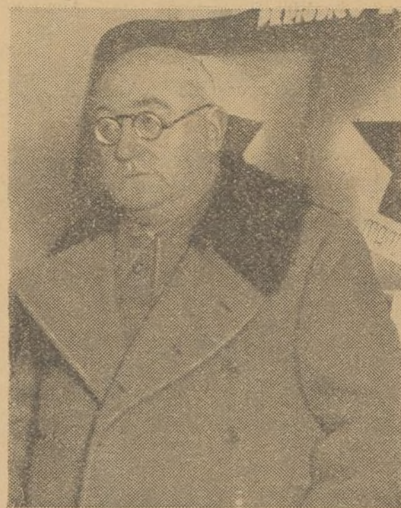
El general Miaja, jefe del Ejército del Centro, para quien pedimos la Gran Cruz Laureada