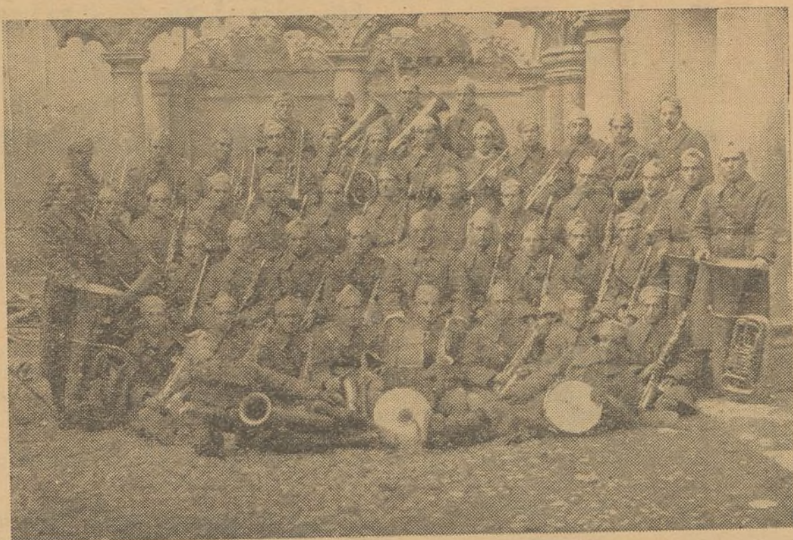
BANDA DE MUSICA FRENTE DE LA JUVENTUD, VALENCIA