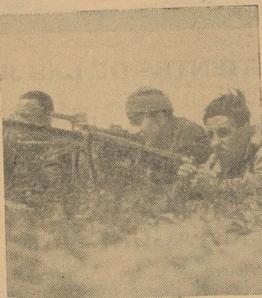
Nuestros bravos luchadores preparan el fusil ametralladora, con gran entusiasmo y ganas de usarlo

e) Constituir los batallones de Hostelería adscritos a Intendencia militar, para realizar en el frente el trabajo específico de estos compañeros, que tan necesario es a los componentes del Ejército popular.