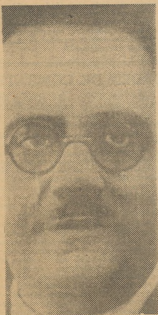
Presidente del Consejo de ministros del Gobierno central de la República.