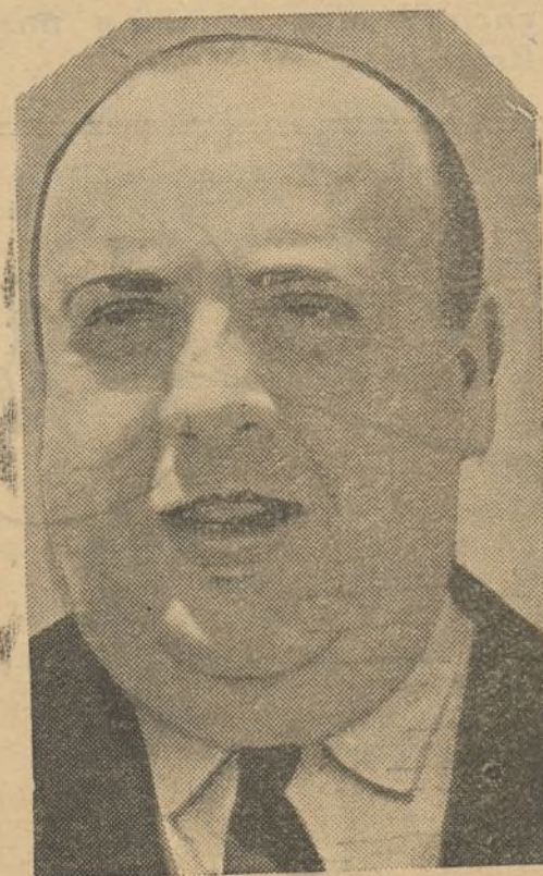
Ministro de Defensa Nacional, en quien confiamos seguros de que sabrá organizar rápidamente una ofensiva general que nos lleve a la victoria.

activa y que los batallones y las brigadas empuen a avanzar en todos los frentes. Que no se hable ya más en España del mando único; que en Euzkadi, como en Aragón y en Madrid, las tropas estén bajo un solo mando. Y querremos una política de reservas, consecuencias y educadas.»