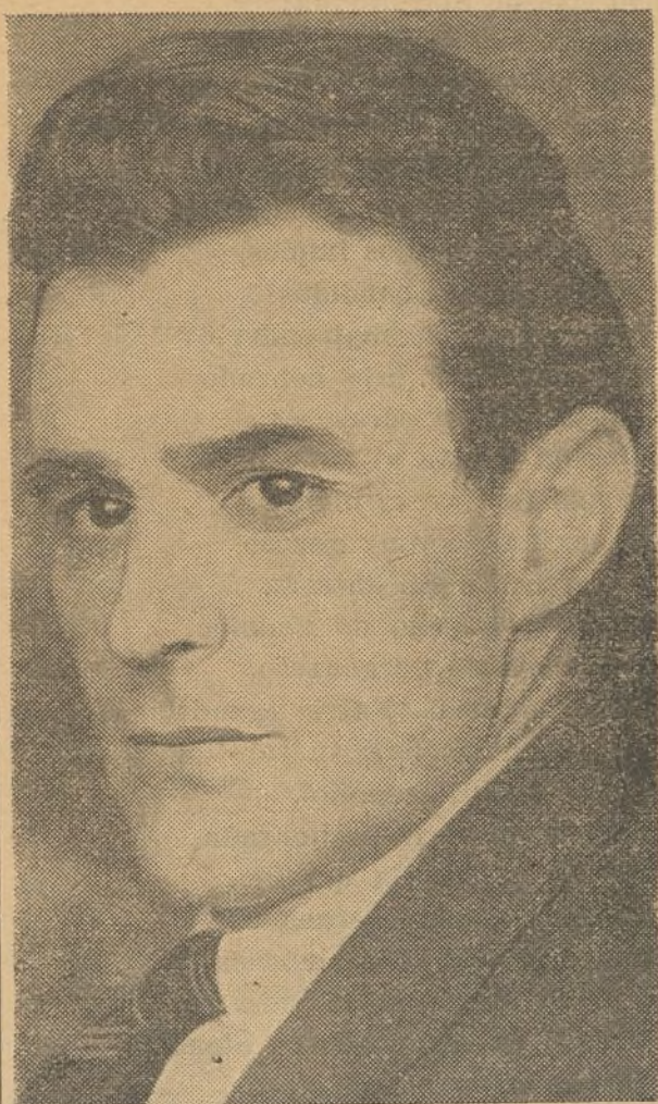
Secretario general del Comité Central del Partido Comunista de España y una de las principales figuras del Frente Popular, en quien tienen depositada la confianza millares de trabajadores.