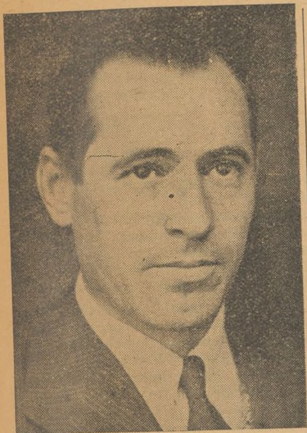
Camarada Vicente Uribe, ministro de Agricultura, que ha dictado una ley legalizando todas las colectividades agrícolas. Los campesinos confían en el ministro del agro español

Los gloriosos soldados de Madrid, los heroicos soldados de todos los frentes, gritan hoy también, con sus bayonetas en alto: «¡¡Venceremos!!»