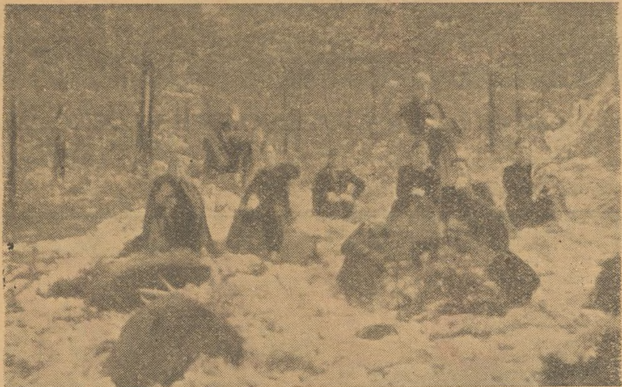
La nieve aun cubre los picachos de Peñalara. En lo alto de la Sierra, un grupo de soldados del Frente de las Juventudes Valencianas, que con heroísmo se han batido en los últimos combates, descansan en los picachos que salen entre la nieve.