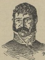
Juan Martín el Empeinado

La figura magnífica del gran guerrillero de la Independencia de 1808, Juan Martín el Empeinado, se agita ante el transcurso de los años, y en estos momentos en que la Inde-