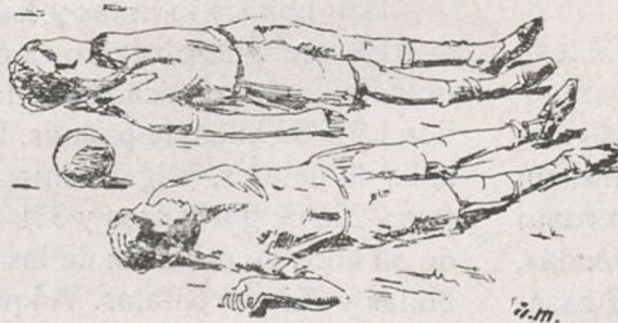
(Dibujo de ABAD MIRÓ)