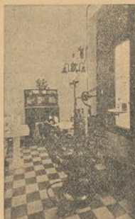
Gabinete Dental Hospital núm. 1

Este hospital tiene capacidad para 310 heridos, distribuidos en 23 gran- (Termina en la cuarta página)