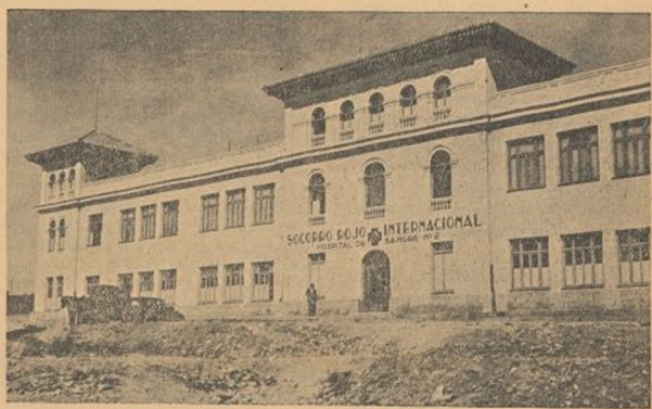
Fachada principal del Hospital núm. 2

Nuestro primitivo Hospital número 1, fué trasladado al grupo escolar de las Carolinas. Es un hermoso edificio de estilo moderno con planta baja y dos pisos. Dieciséis amplias salas permiten alojar a un total de 206 heridos y enfermos. Además cuenta con una gran cocina, despen-