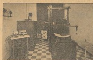
Gabinete de Rayos X del Hospital núm. 1

Nosotros sabemos que ha hecho muchas cosas buenas el Socorro Rojo internacional, pero desde nuestro punto de vista, lo que más simpatías hacia él, nos ha despertado, ha sido la eficaz y desinteresada ayuda que desde el principio de esta Guerra fratricida - por la República