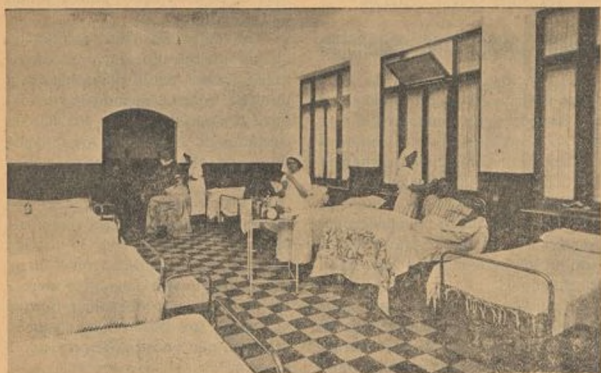
Uno de los salos del Hospital núm. 2

des salas (alguna de ellas para 50 camas). Una de las salas fué amueblada por la Asociación de Comadronas. Estas compañeras se encargan del servicio de enfermeras de su sala, poniendo en la atención de los heridos todo su cariño. Otras dos salas fueron amuebladas por los compañeros del Sindicato de Empleados de la Diputación.