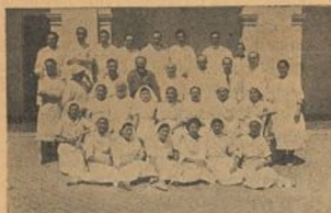
Personal del Hospital núm. 2

El Socorro Rojo Internacional espera tu donativo para los Hospitales de Sangre. En ellos hay heridos a quienes atender. Son camaradas que se lo merecen todo; nosotros debemos hacer su convalecencia, digna de su sacrificio. No vaciles, pues, en cumplir tal deber de humanidad.