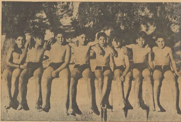
Un grupo de niños después del baño

Correan, juegan y saltan por los parques estos nuevos diablillos que la lucha nos trae consigo. Para ellos no hay pueblos, no existen fronteras, han sabido comprender mejor que los adultos las ideas internacionalis-