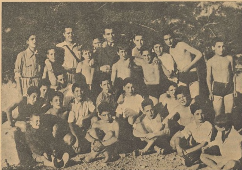
Terminada la gimnasia, unos minutos de descanso tomando el sol en el parque