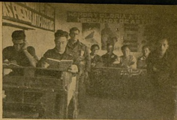
A pocos metros de la línea de fuego los soldados de la Brigada se instruyen.

que dejar las armas para reconstruir nuestra patria y, entonces, te dará pena y dolor ver que has dado todo tu esfuerzo y todo tu heroísmo para conseguir la victoria, y en la paz no puedes aportar más que el esfuerzo de tus brazos, sin poder ofrecer a tus hermanos el tesoro que puede encerrar tu inteligencia; el cual es ineficaz y sin valor por tu desidia y tu pereza.