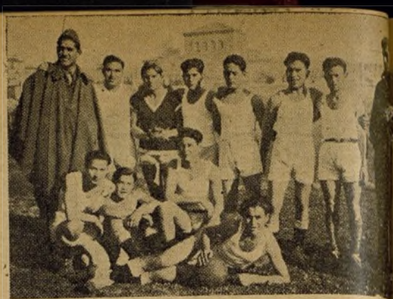
Equipo de fútbol de la Brigada con sus monitores.