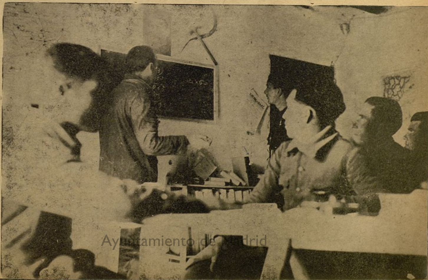
Ayuntamiento de Madrid

El libro es la mejor arma contra los tiranos