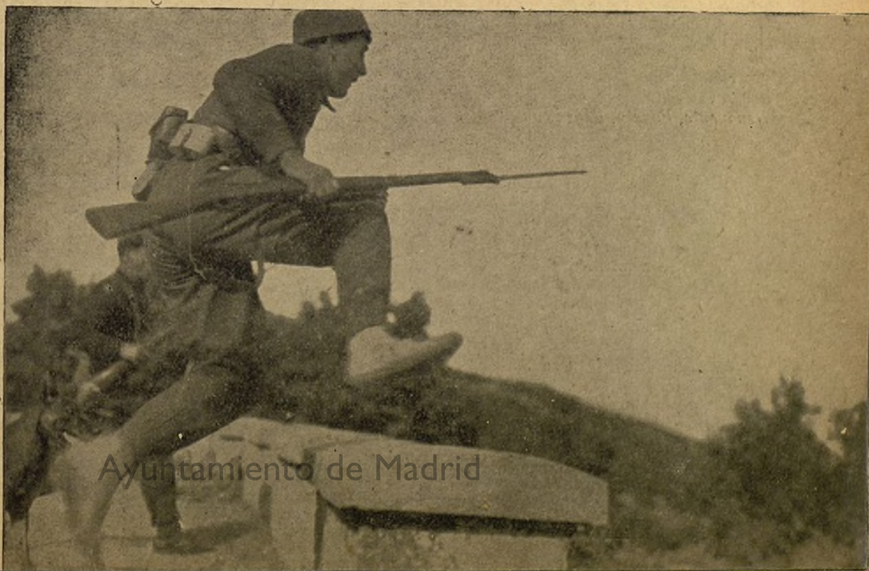
Ayuntamiento de Madrid

“Es ante una buena fortificación, donde debe estrellarse el enemigo, no ante la muralla de vuestros pechos”