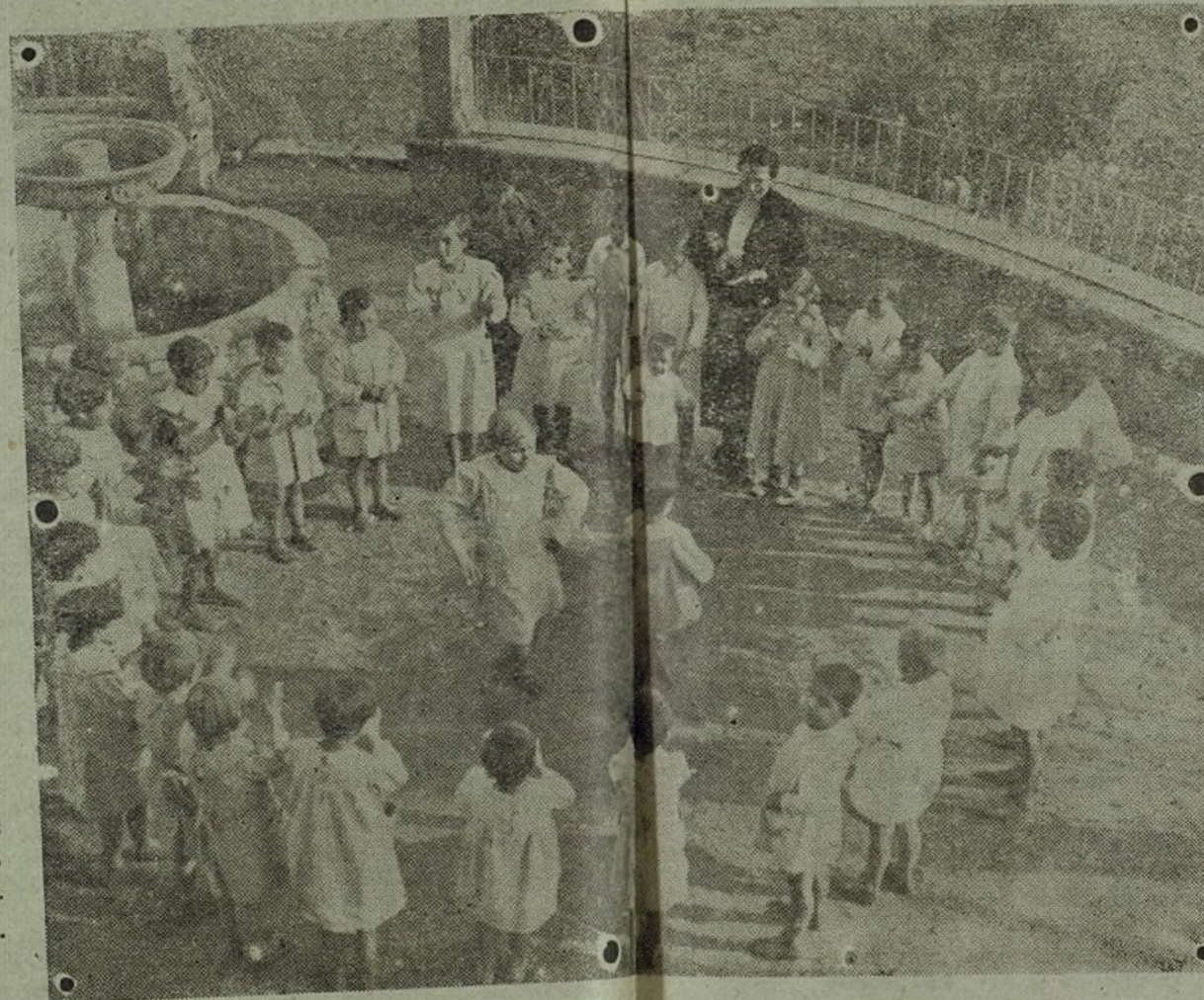
Unos momentos de descanso.- Los «peques» juegan y se divierten al aire libre.

Un ex-profesor de los C. de H. de Artillería e Ingenieros, Marina y Correos.