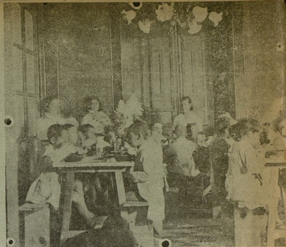
¡A comer! - Se ve que tienen apetito

El maestro es un viejete también bonachón, simpático, que ofrece la doble condición de ser practicante; de ahí que los