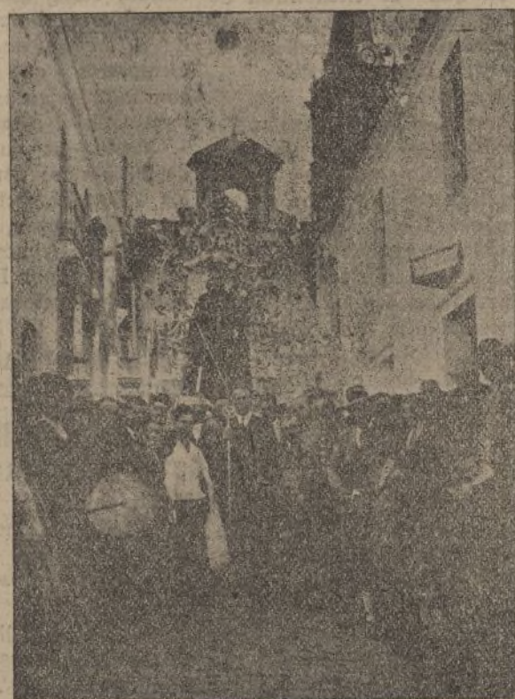
Un momento de la procesión

Las fiestas de San Antonio Abad tan íntimamente ligadas al laborioso pueblo de Trigueros en sus fastos tradicionales, adquieren de nuevo en este año de la liberación de España, toda antigua brillantez y vigoroso esplendor.