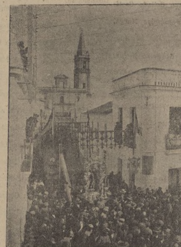
El Santo, precedido del pueblo, marcha a reintegrarse a su Capilla

Durante las noches de las fiestas, lucirán espléndida y artística iluminación instalada por la «Eléctrica Española» la fachada de la Casa Consistorial, calle Fernando Belmonte y Plaza de Queipo de Llano. En el «Círculo de Labradores y Propietarios» se celebrarán Bailes y en el Cinema San Telmo se exhibirán Extraordinarias Películas Sonoras.