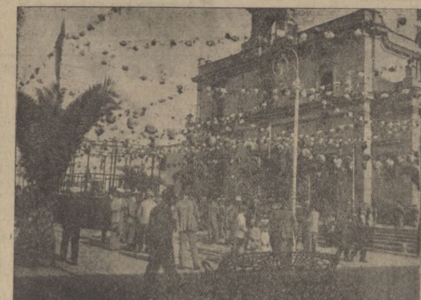
PLAZA DE QUEIPO DE LLANO

Narciso Vides Fábrica de Cerámica Teléfono núm. 5 TRIGUEROS (Huelva)