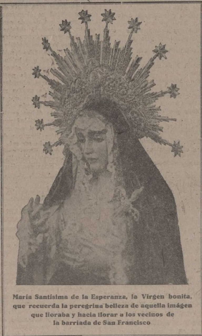
María Santísima de la Esperanza, la Virgen bonita, que recuerda la peregrina belleza de aquella imagen que lloraba y hacia llorar a los vecinos de la barriada de San Francisco

Al descender Su Excelencia del coche revisó las fuerzas que le rindieron honores, las cuales desfilaron después ante Su Excelencia. Los aplausos y vítores entusiastas de la muchedumbre se repitieron cuando el Generalísimo después del desfile de las fuerzas se retiró al palacio.