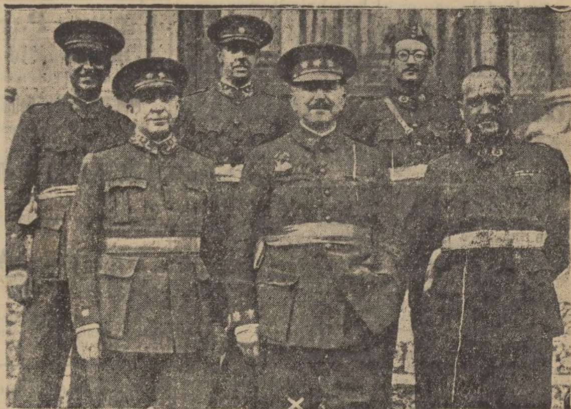
El coronel Moreno Calderón (x), jefe de Estado Mayor de las fuerzas militares de Burgos, con un grupo de oficiales.

Se advierte a los contribuyentes en general que la recaudación voluntaria de los recibos de contribuciones del actual trimestre se ha prorrogado hasta el día 10 del actual mes de Septiembre.