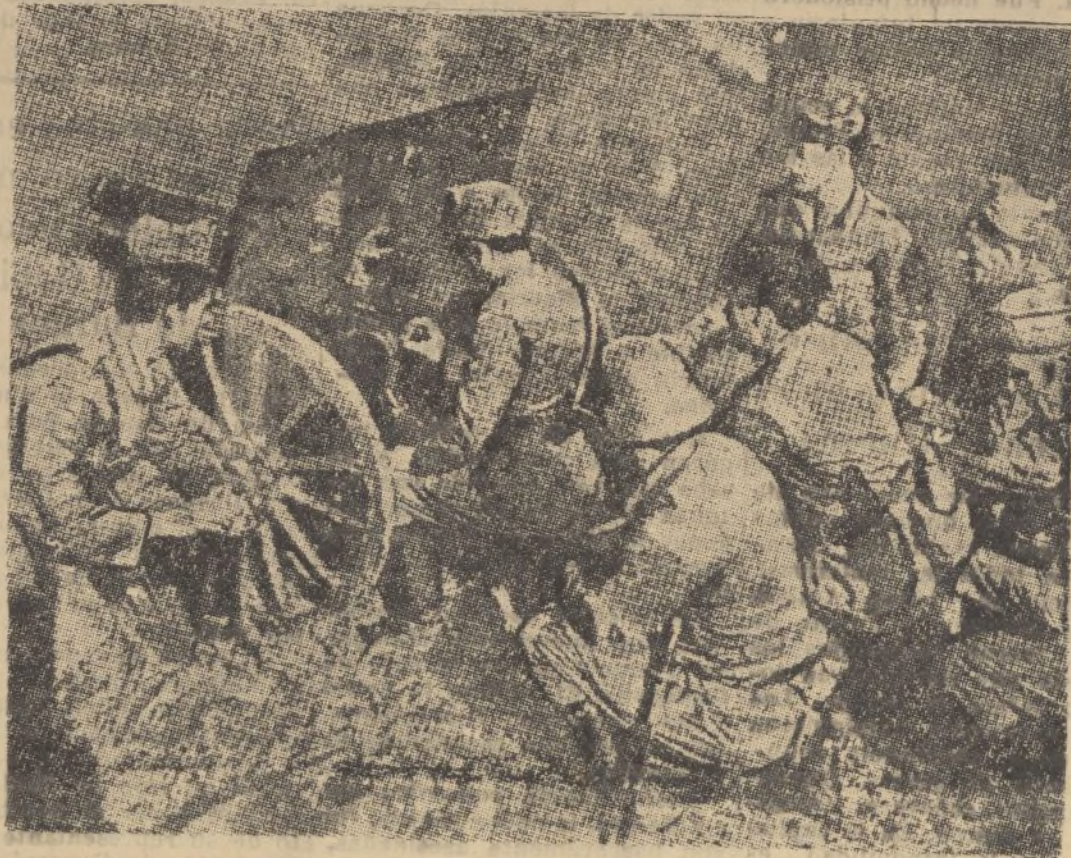
Un cañón de las fuerzas nacionales, haciendo fuego contra los marxistas.