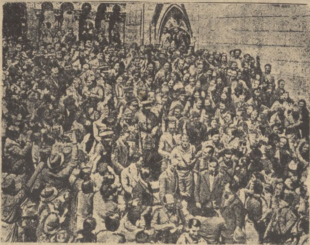
Los generales Franco y Mola, que están dirigiendo con extraordinario acierto las operaciones contra las milicias marxistas. Ambos héroes aparecen en la «foto» después de una ceremonia religiosa celebrada en Burgos