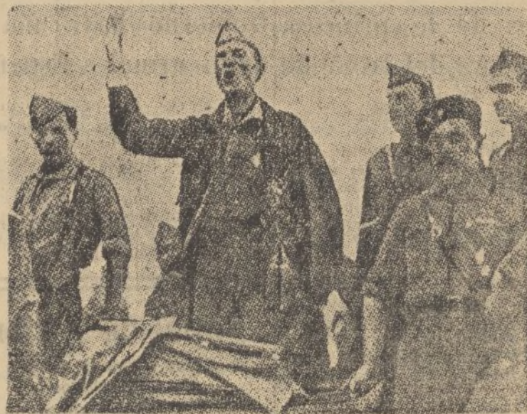
El general Millán Astray, glorioso creador del Tercio pronuncia un elocuente discurso en Zaragoza