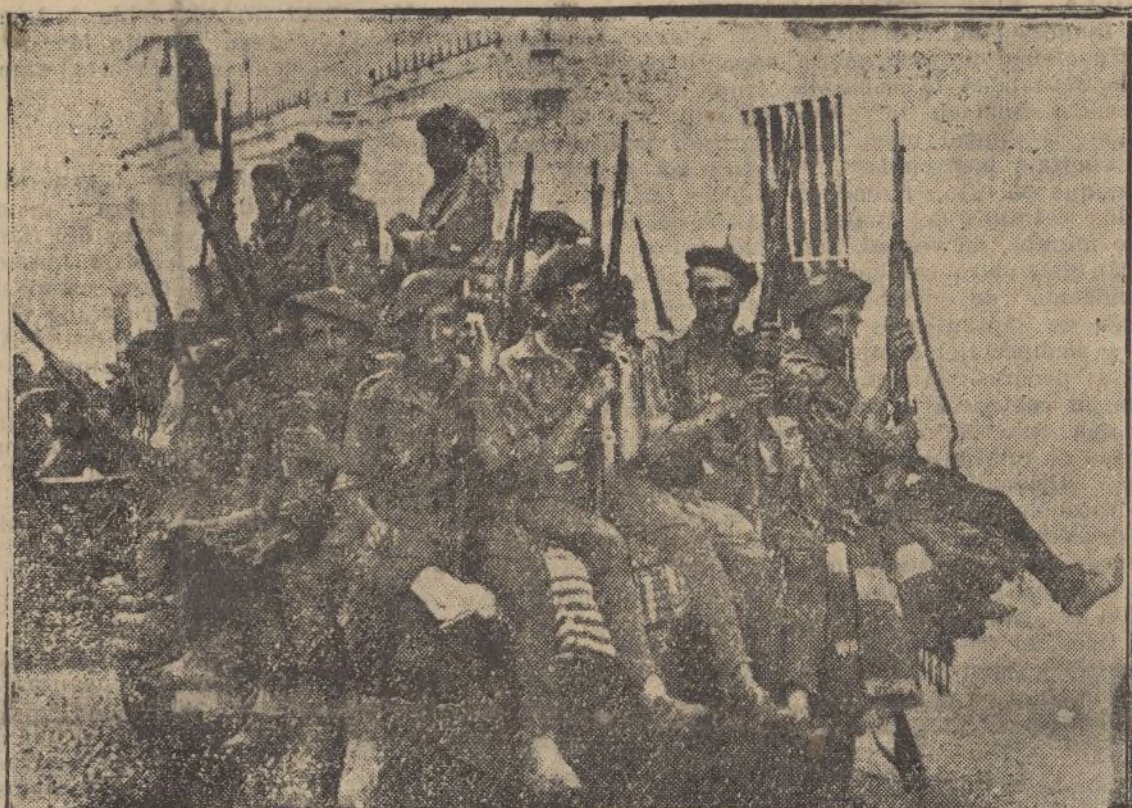
Un camión con «requetés», que han prestado brillantes servicios en la sierra de Huelva

El hecho ha producido la más viva repulsa en toda la Marina y en todo el país».