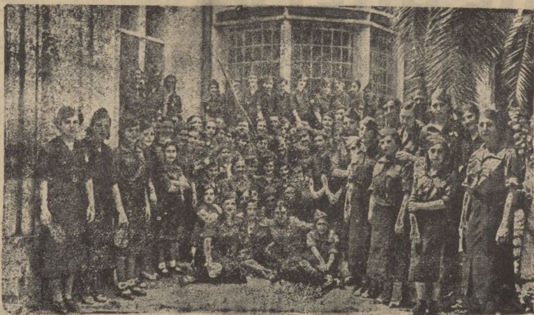
JEREZ DE LA FRONTERA.—Grupo de simpáticas y bellísimas falangistas que desfilaron por las calles de Jerez, entre constantes aclamaciones y aplausos