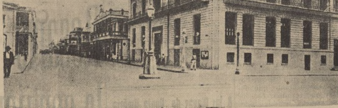
Colón (Panamá).-Palacio de la Gobernación

Esta es la que está actuando ahora en Huelva para esclarecimiento de determinados hechos y determinación apropiada a lo que dichos hechos se desprenda para culpables y en relación al grado de culpabilidad que sobre estos recaiga.