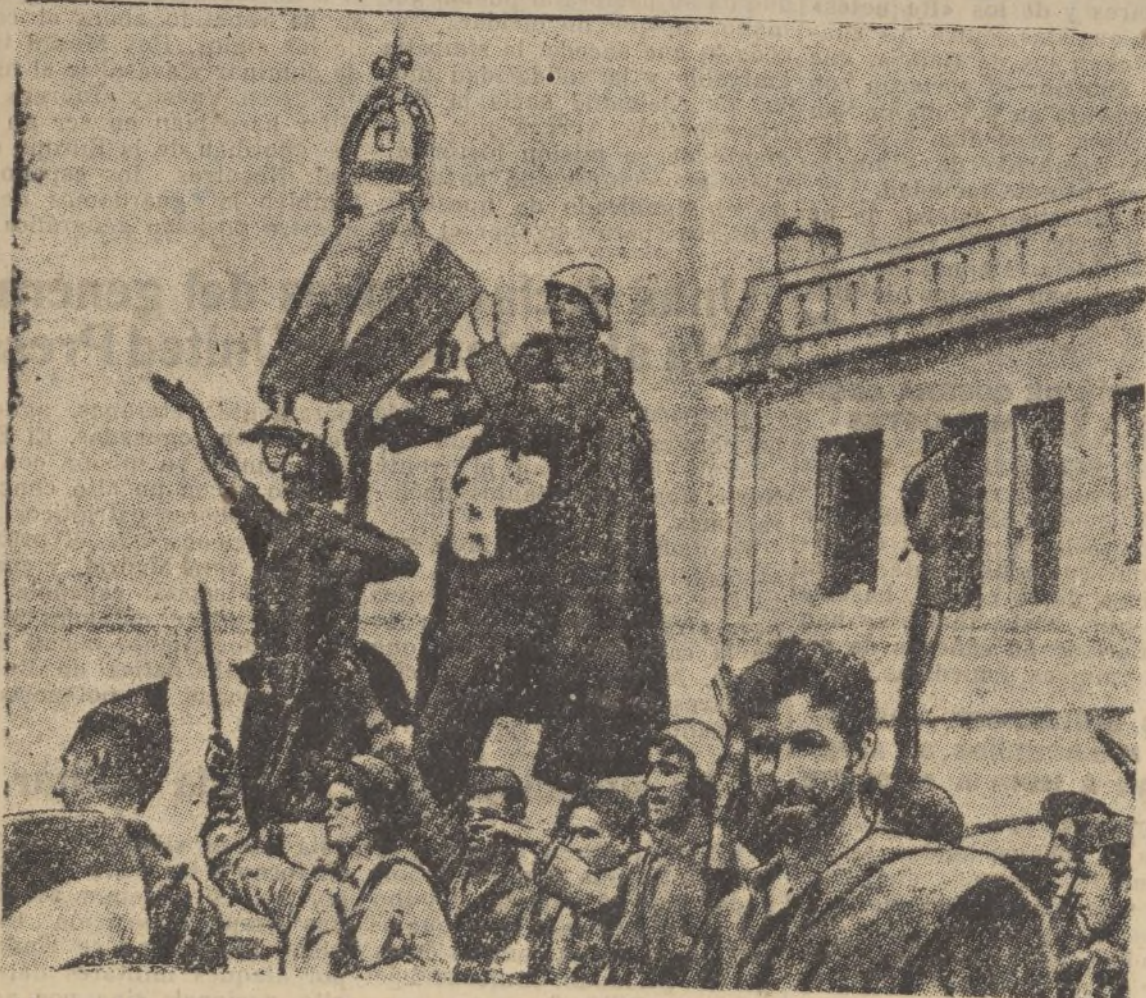
Al entrar las tropas nacionales en Irún, colocan la bandera española en uno de los postes de la luz eléctrica.

“ Diario de Huelva ” Gravina 4 y Calvo Sotelo 15