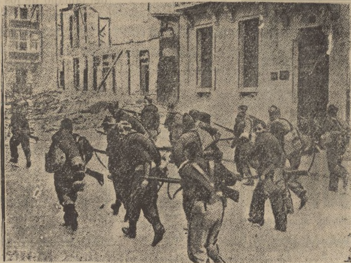
Las tropas nacionales entran victoriosas en Irún, huyendo los rojos después de arrasar la población.

Neveras :: Heladoras Ventiladores eléctricos THERMOS Veladores con tapas de mármol