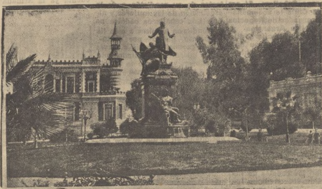
Plaza de Vicuña Marckenna