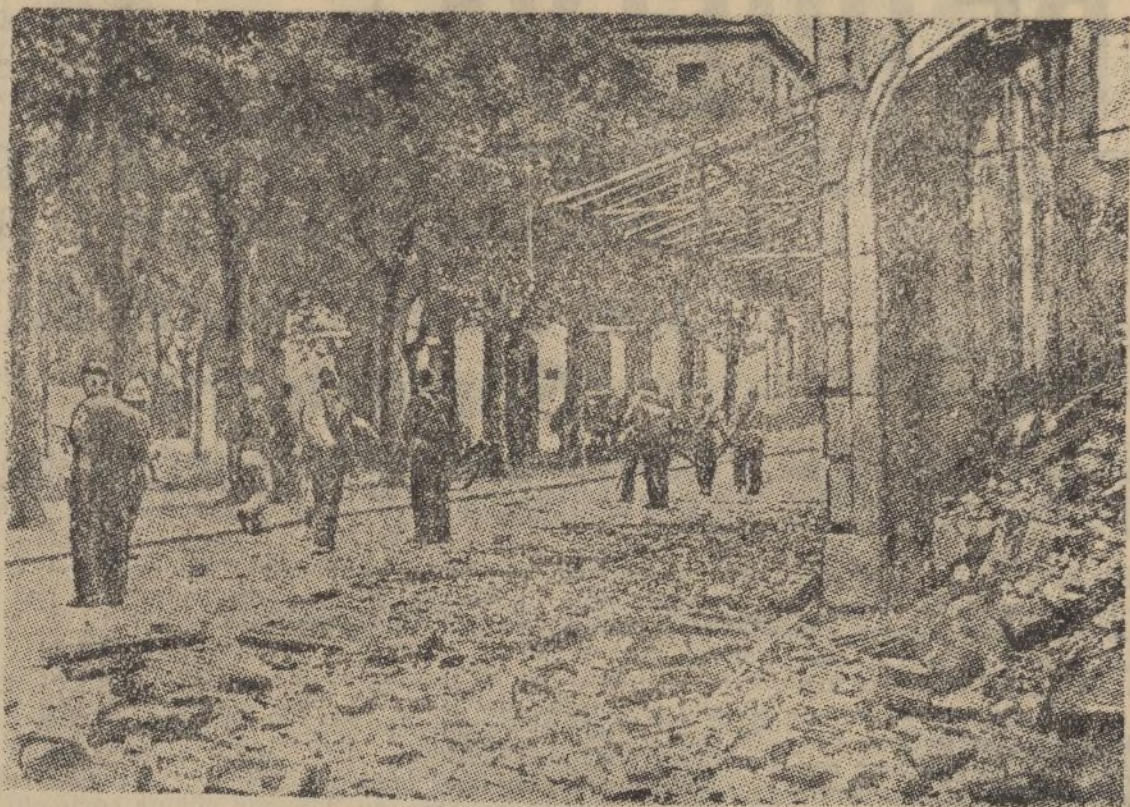
Un aspecto tristemente desolador de Irún a la llegada de las fuerzas salvadoras de España.