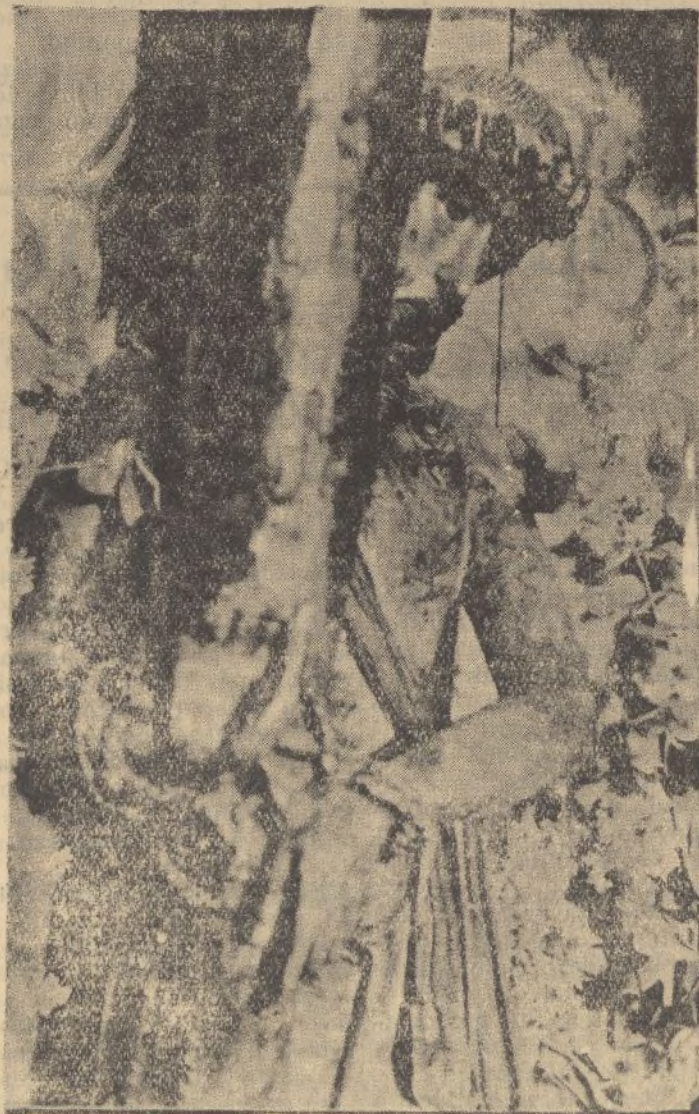
Nuestro Señor de la Columna, bellísima escultura del s'g'o XI, rescatada de las turbas comunistas que saquearon el Museo Arqueológico de Niebla.