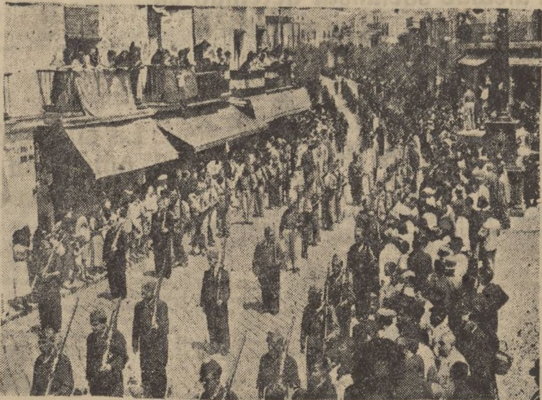
JEREZ DE LA FRONTERA.—Las milicias cívicas jerezanas, desfilando por las principales calles de la población, en las que fueron ovacionadas por el público.