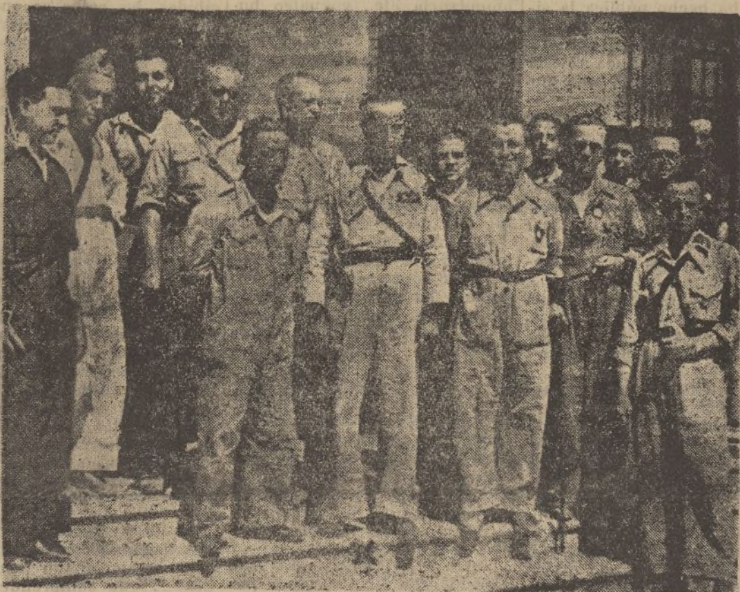
El general Varela (X), con su Estado Mayor, en la finca «La Malagueña», tomada a los marxistas

Sonaron unos tiros, y el cuerpo del mártir que tan dignamente muriera por España, cayó para siempre.