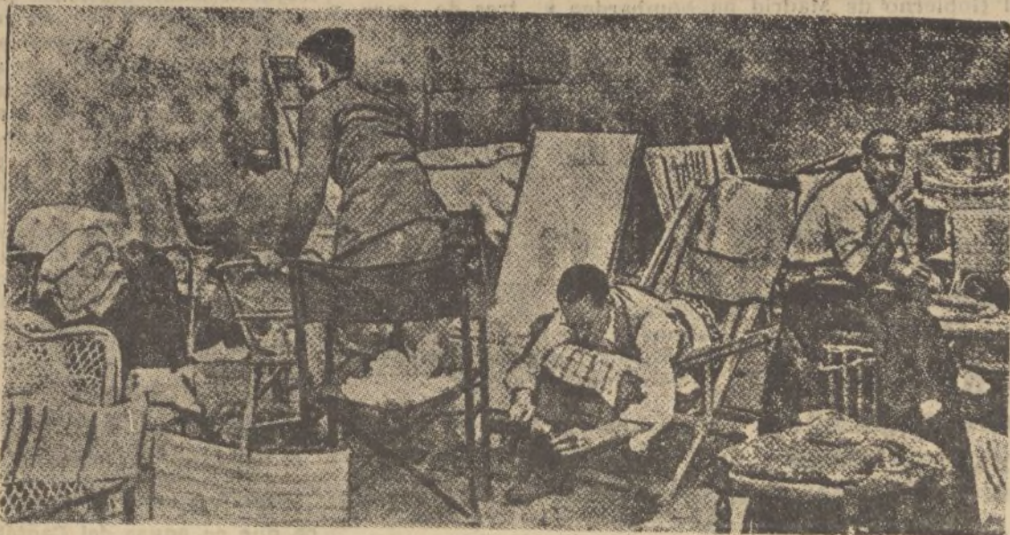
En una de las dependencias de El Escorial, los marxistas tienen recluidas a caracterizadas personas de la aristocracia madrileña que fueron hechas prisioneras, cuando veraneaban en el Guadarrama. Las circunstancias obligan a los detenidos a una vida en común sin comodidades de ninguna especie.

zarpó ayer de San Sebastián llevando a bordo 500 presos marxistas.