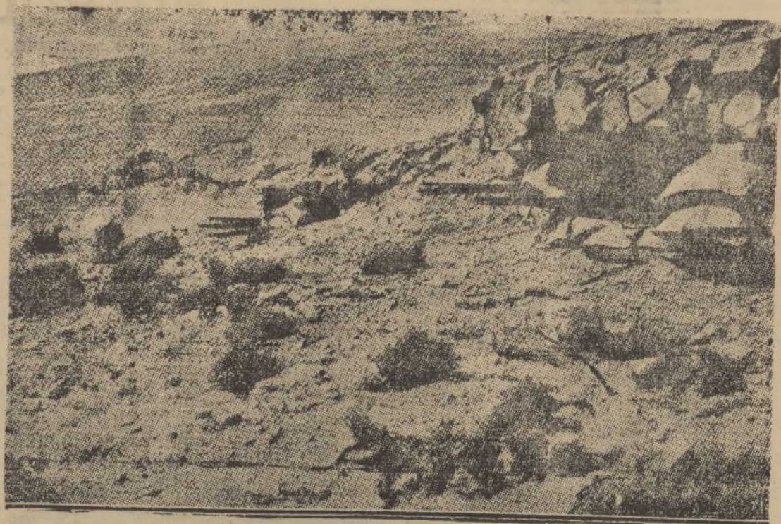
Los soldados del Ejército nacional, ocultos en una trinchera del Guadarrama, definen un ataque de los marxistas. Apenas se ven los cañones de los fusiles de las fuerzas de Burgos