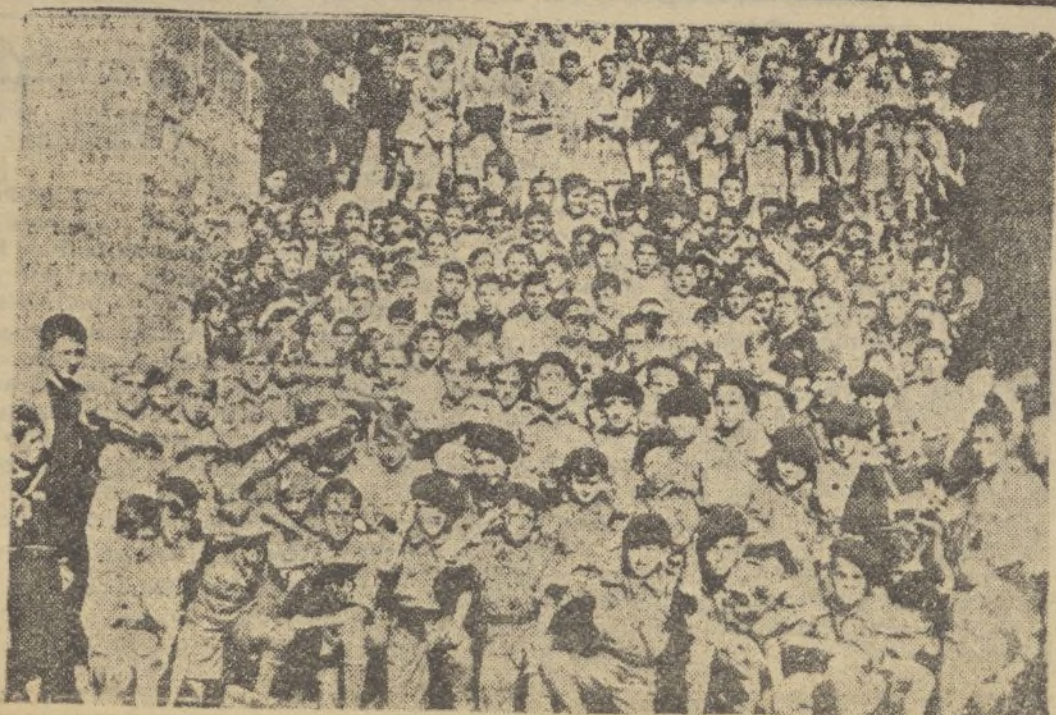
Los «pelayos» de Salamanca

NOTAS.—En la Secretaría de este Centro, están a disposición de quien lo desee, los datos que puedan comprobar la veracidad de esta nota.