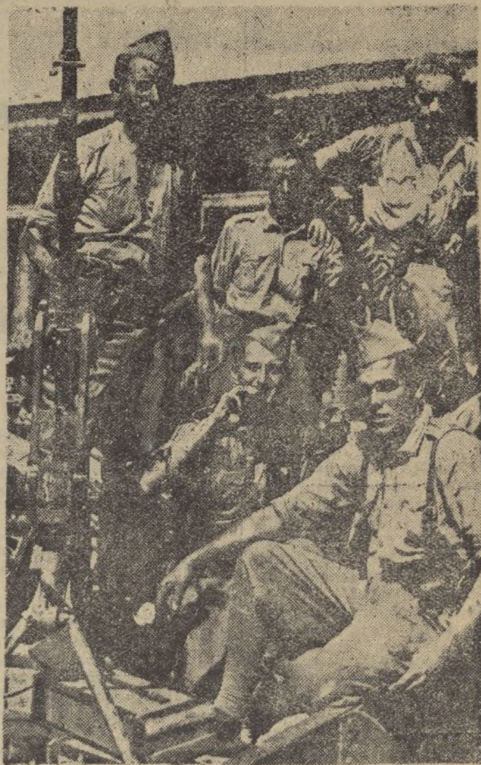
Soldados del Tercio que luchan en la vanguardia de las fuerzas que se dirigen a Madrid

Nos reunimos todos los sábados y daremos una nota a la prensa, que el público debe leer para estar enterado de las medidas de seguridad que se van tomando.