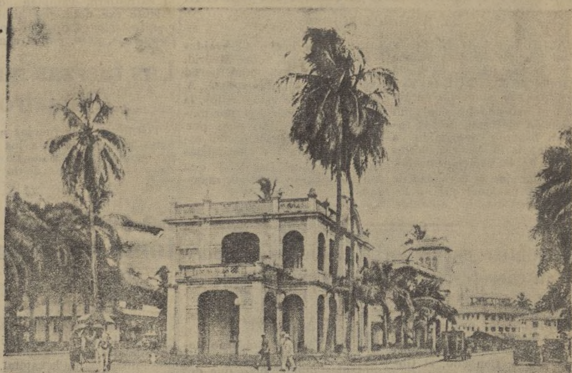
Ciudad Colón.- Oficinas de la Transatlántica Española