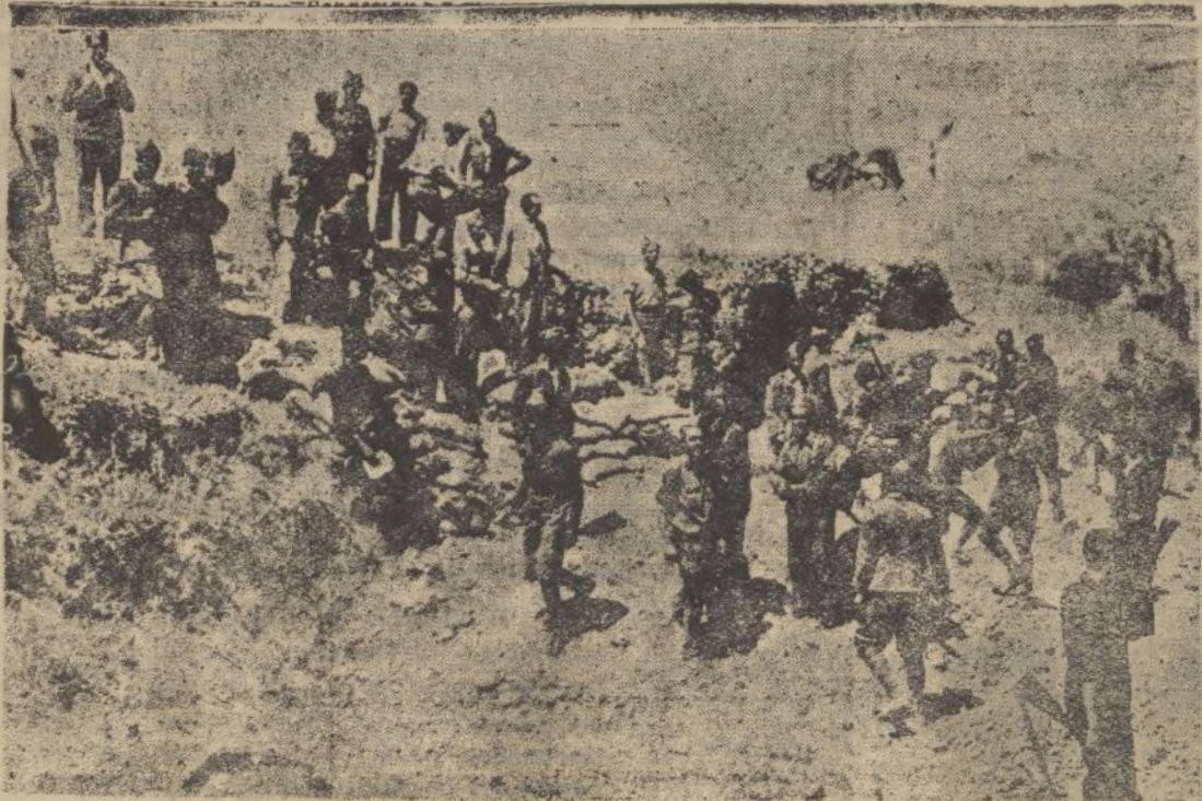
Tropas de la guarnición de Granada, que tomaron un campamento de fuerzas marxistas en los límites de Jaén.