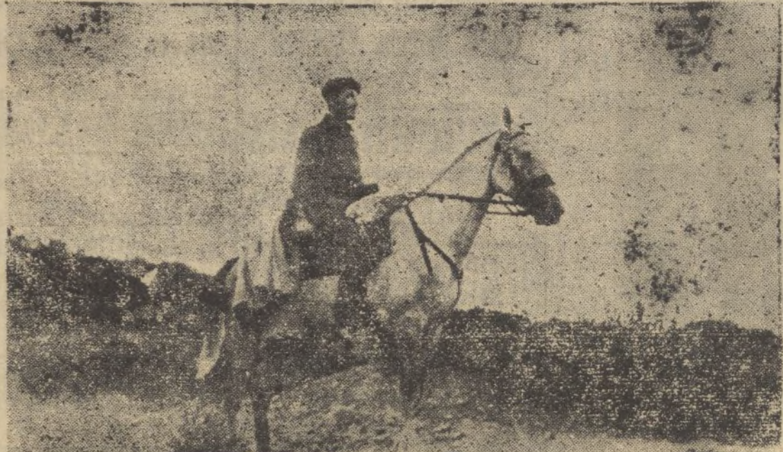
Uno de los bravos héroes en la columna navarra