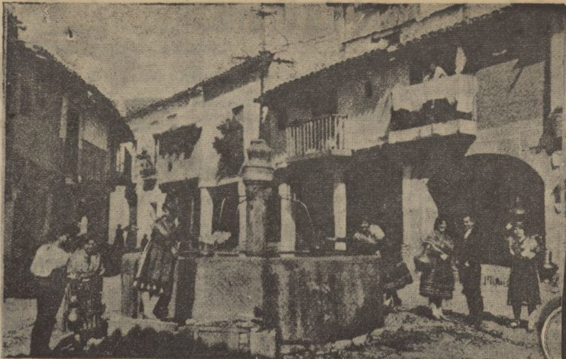
CÁCERES.—Una plaza en Guadalupe

Al llegar al Cementerio, el jefe provincial de Falange dirigió una alocución a las fuerzas.