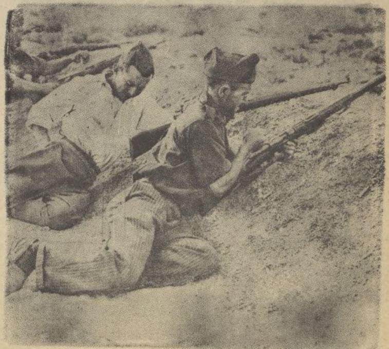
Voluntarios recientemente incorporados a las tropas nacionales, luchando en el frente de batalla