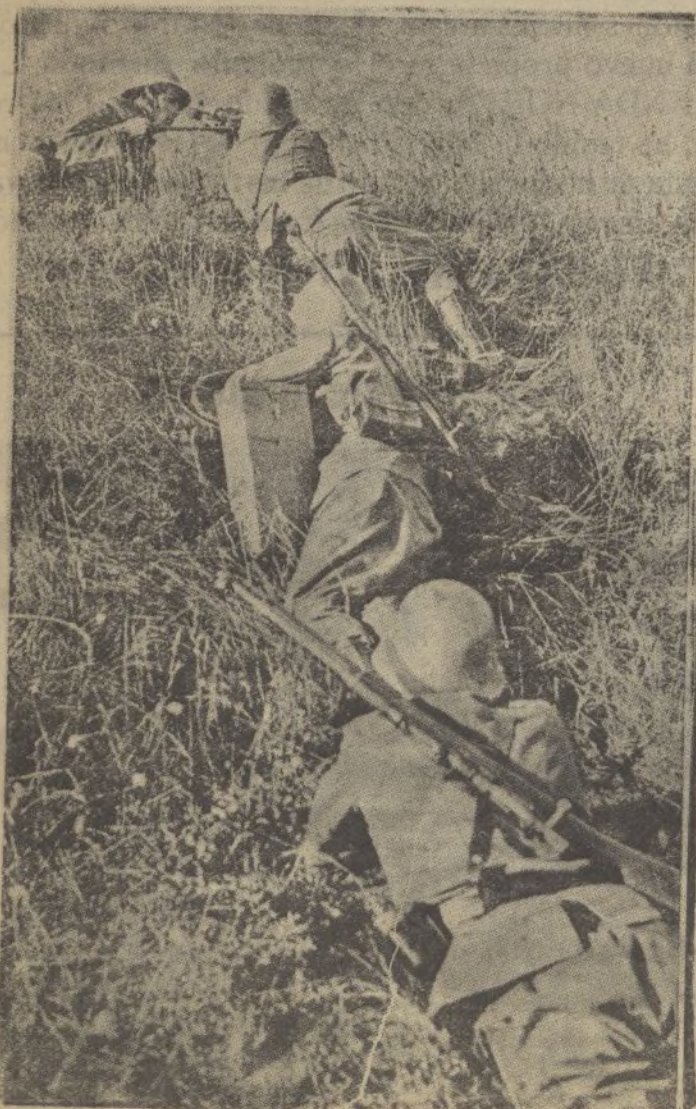
Soldados nacionales deslizándose por los campos próximos a San Sebastián en acecho de las fuerzas rojas.