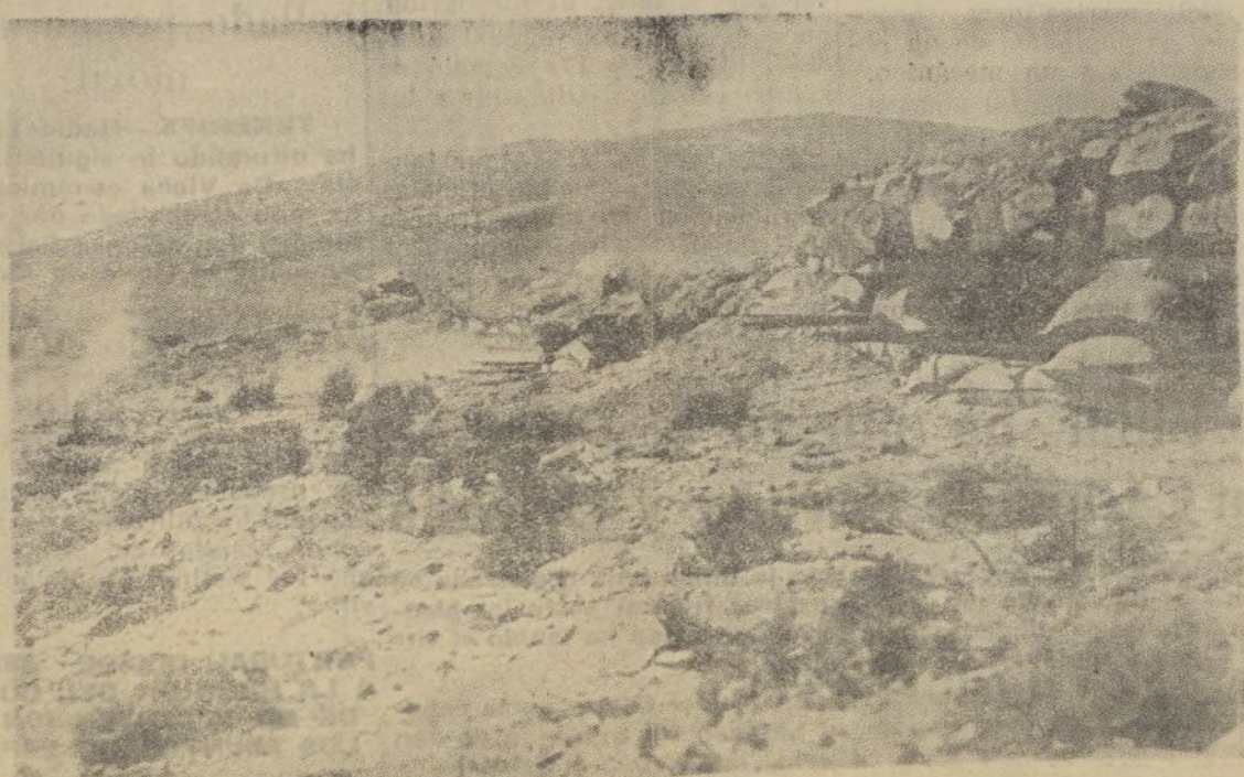
Soldados de Infantería de las tropas de Mola parapetados tras emplazamientos de rocas y sacos de arena en el frente de Guadarrama Ayuntamiento de Madrid