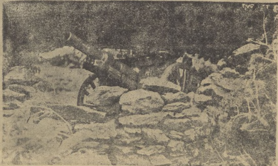
Una de las piezas de nuestra Artillería de montaña, que tan brillantísimo papel está desempeñando en el frente.