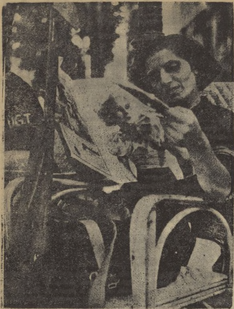
Un ejemplar—y buen ejemplar, como puede verse!—de una miliciiana marxista hojeando una revista, sentada en una terraza de Barcelona, al lado de un camarada de la U. G. T.