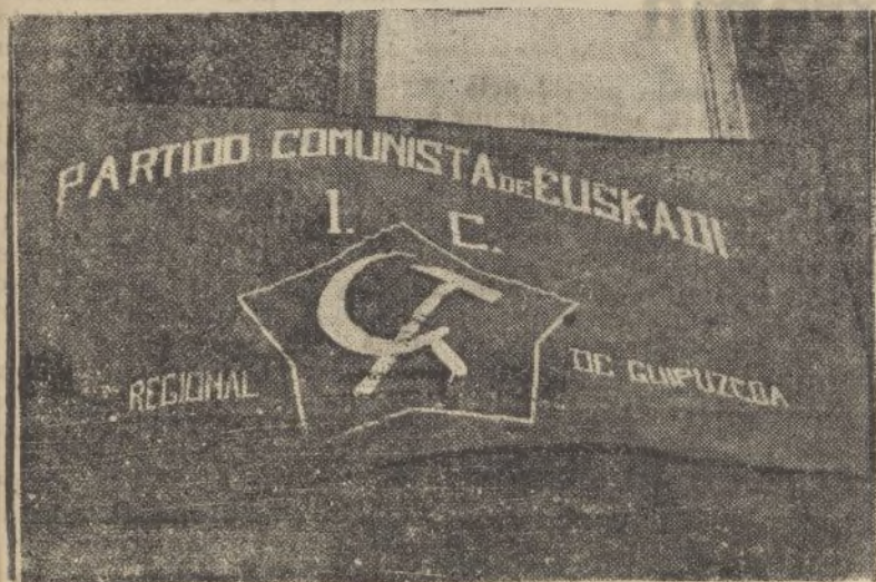
La bandera comunista que aparecía en la fachada del Gran Restaurant de San Sebastián, del que se apoderaron los rojos para establecer su Hotel