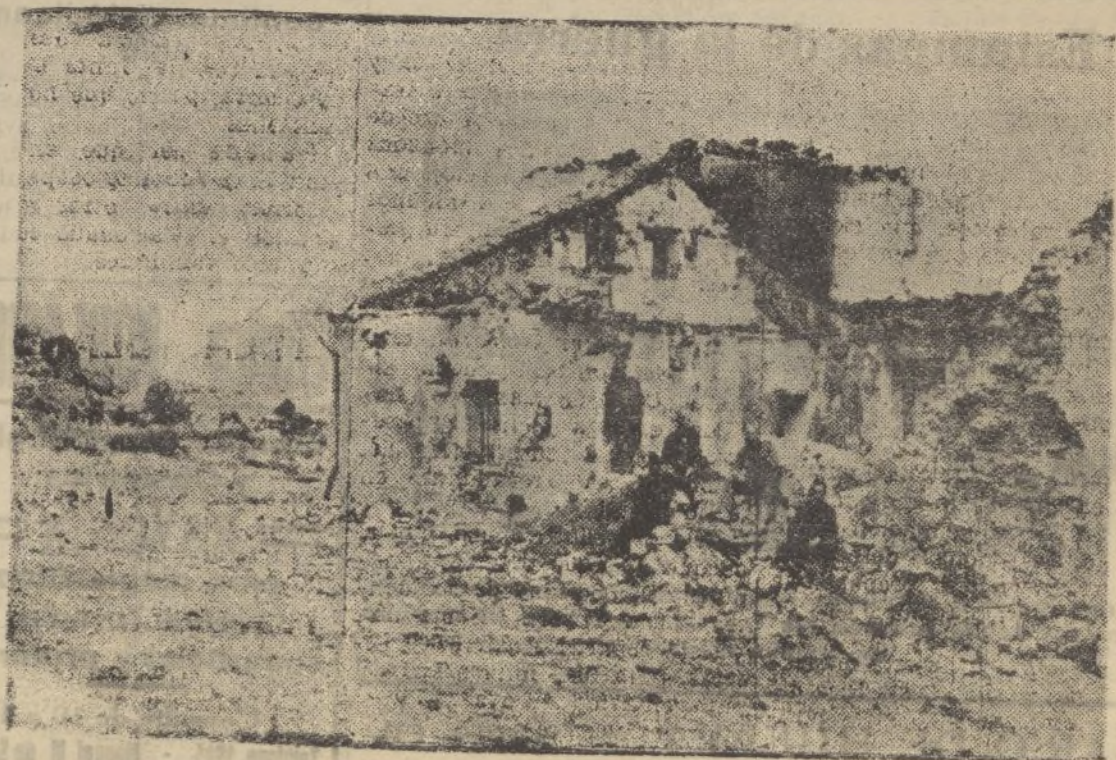
Casa forestal del pinar de Navafria, en el valle del Lozoya, donde fueron encontrados 70 marxistas muertos por el bombardeo que precedió al último avance.