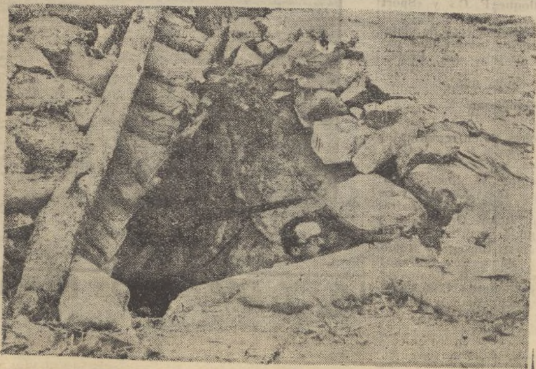
Subterráneo de paso hecho por el enemigo en sus trincheras del puerto de Navafria ocupadas por nuestras tropas.

TRANSPORTE GRATIS so- bre muelles de este puerto o domicilio del comprador, dentro del radio de esta capital.