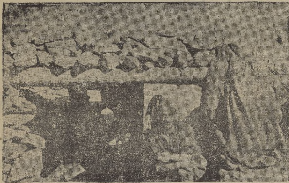
Uno de los cañones, con municiones, cogidos a los rojos en el reciente avance del valle de Lezoja, que ha sido utilizado por nuestras tropas para cañonearles en su retirada.

communica a su distinguida clientela el traslado de su Peluquería a la calle José Nogales, núm. 3.—Tel. 1280