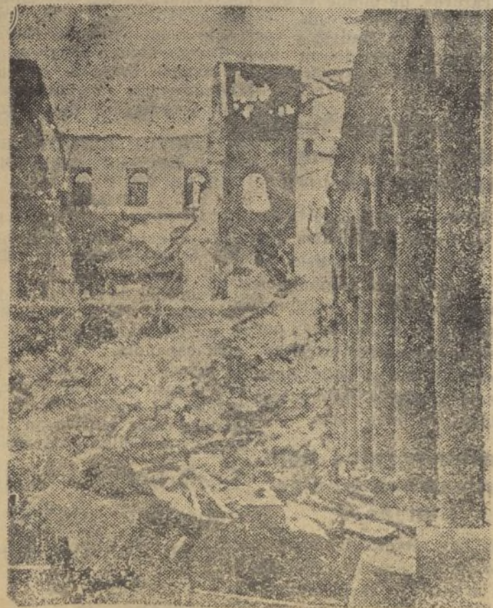
Patio del Alcázar.—Al fondo, un torreón vaciado

MADRID.—Terminada la vista de la causa contra los artilleros que se sublevaron en Vicálvaro, es probable que el Tribunal Popular descanse durante dos días. Seguidamente, el tribunal comenzará a juzgar el tercer proceso relativo al cuartel de la Montaña, en el que están acusados numerosos elementos militares y civiles.