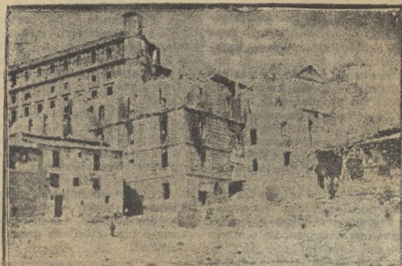
Vista exterior del Alcázar de Toledo