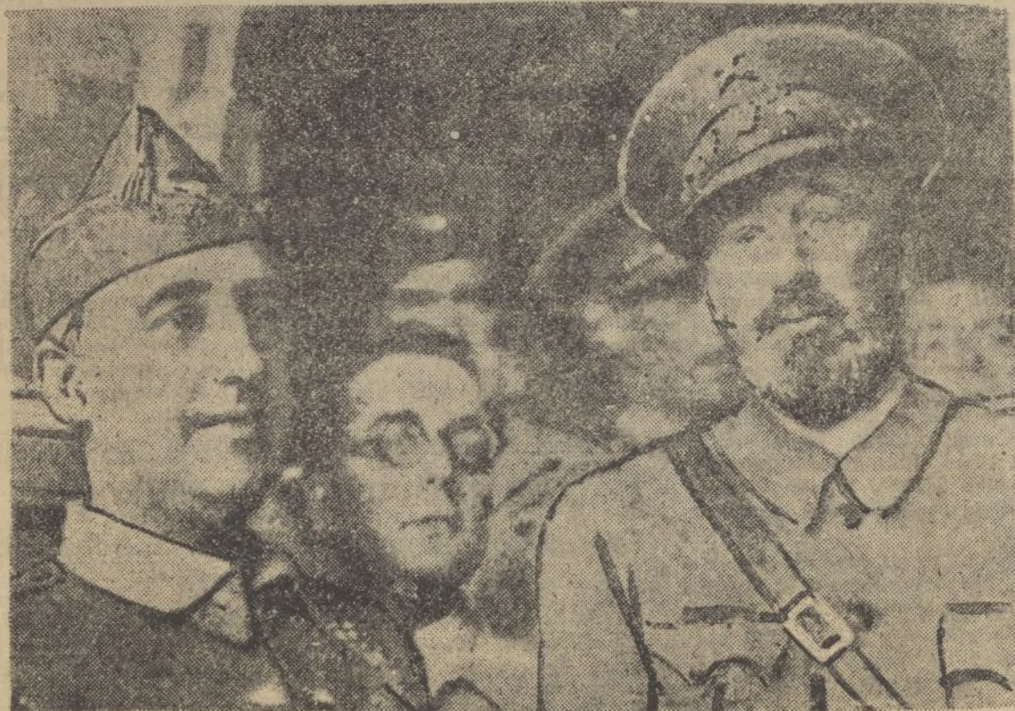
El general Franco, jefe supremo del Gobierno nacional, con el bravo coronel Moscardó, que mandaba las fuerzas en la emocionante defensa de Madrid

donde encontrará un extenso y variado surtido en plumas estilográficas y artículos de escritorio