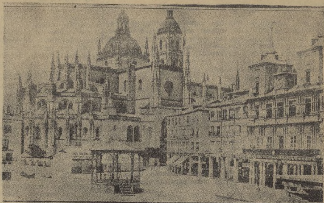
Segovia.-Plaza de la Constitución

dome sola entre aquella gentuza, llegó un camión con la Guardia civil española. El «chofer» le avisó. El coronel Vera Terán, abrazándome, viendo que echaba sangre por boca y nariz, por el puñetazo que me dió un bandido, me hizo entrar en su automóvil, y me llevó a un Hospital, donde el doctor Pardo Figueroa, me escondió de las furias que despertó mi patriotismo. ¡Viva la Guardia civil!