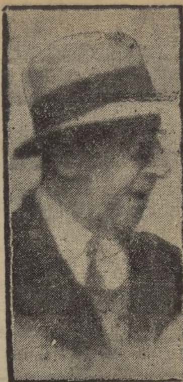
El coronel de Infantería don José Moscardó, que dirigía las fuerzas sitiadas en el Alcázar de Toledo.