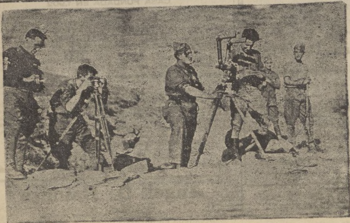
Un puesto de observación en el Ayuntamiento de Madrid