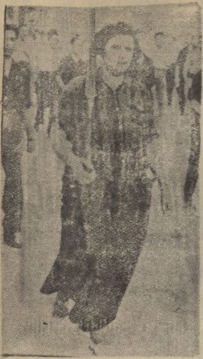
Una dama, escopeta al hombro, pasea por las calles de Barcelona.

La aviación nacional ha bombardeado muy eficazmente las concentraciones marxistas de Málaga.