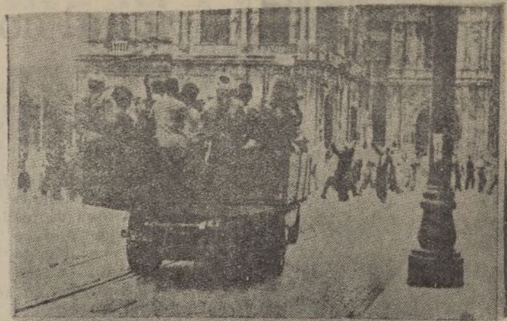
Los regulares entran en Sevilla, ante las continúas aclamaciones del pueblo.