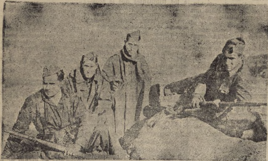
«Peña del Asno», posición en las alturas de La Robla, guardada por tropas del regimiento núm. 31, que la defienden contra las incursiones de las hordas marxistas procedentes de Asturias y el Alto León.