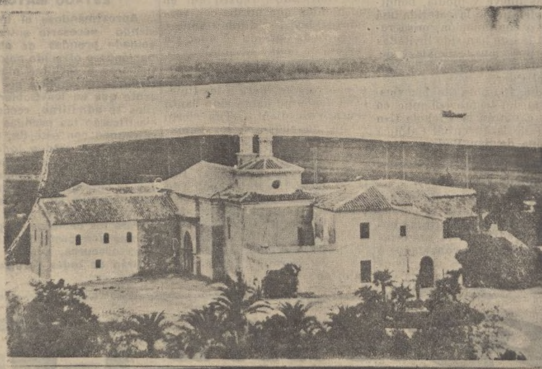
Una hermosa vista del Monasterio de Santa Maria de la Rábida, cuya evocación está íntimamente ligada con la fiesta de la Raza