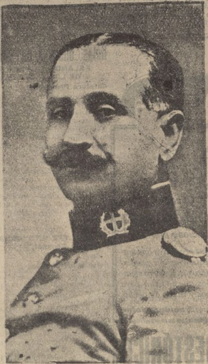
El Excmo. señor don Gonzalo Queipo de Llano, cuyas charlas radiadas mantienen en constante avidez la atención de todos los españoles

Durante este día, funcionará el trasbordador «Montenegro» y seguramente se establecerá un servicio de autobuses que facilite el acceso a la Rábida. ¡Viva España!