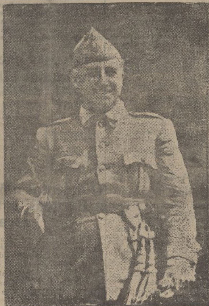
El Excmo. señor don Francisco Franco Bahamonde, jefe del nuevo Estado español y generalísimo de los Ejércitos nacionales, en quien España tiene puesta todas sus esperanzas