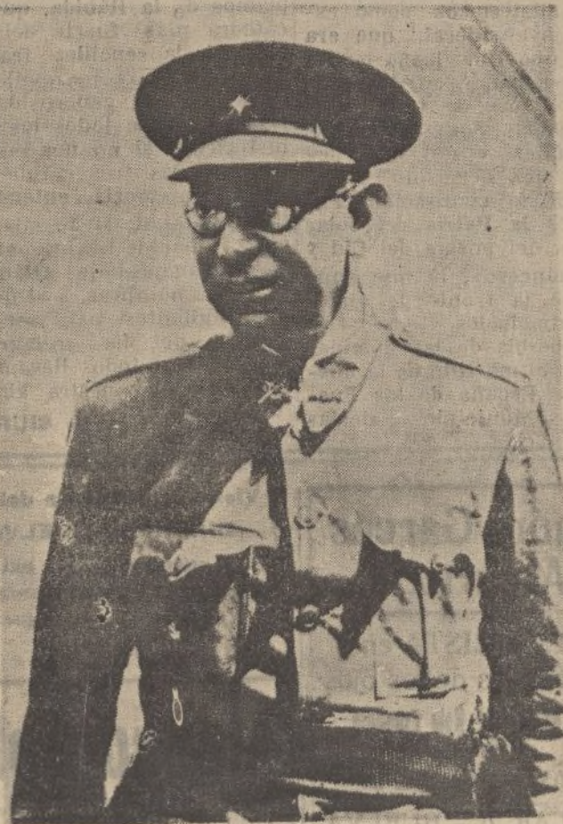
El Excmo. señor don Emilio Mola, ilustre caudillo de las fuerzas que se disponen a tomar la capital de España

PAPEL DE FUMAR Indio Rosa PALADAR SUAVE - COMBUSTIBILIDAD PERFECTA