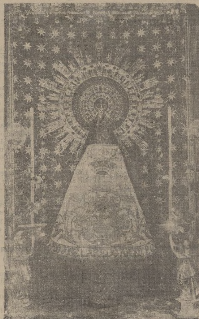
Nuestra Señora del Pilar, cuya fiesta se celebrará mañana, coincidiendo con la patriótica de la Raza

El Conquistador Alonso de Ojeda fué enterrado de pie.