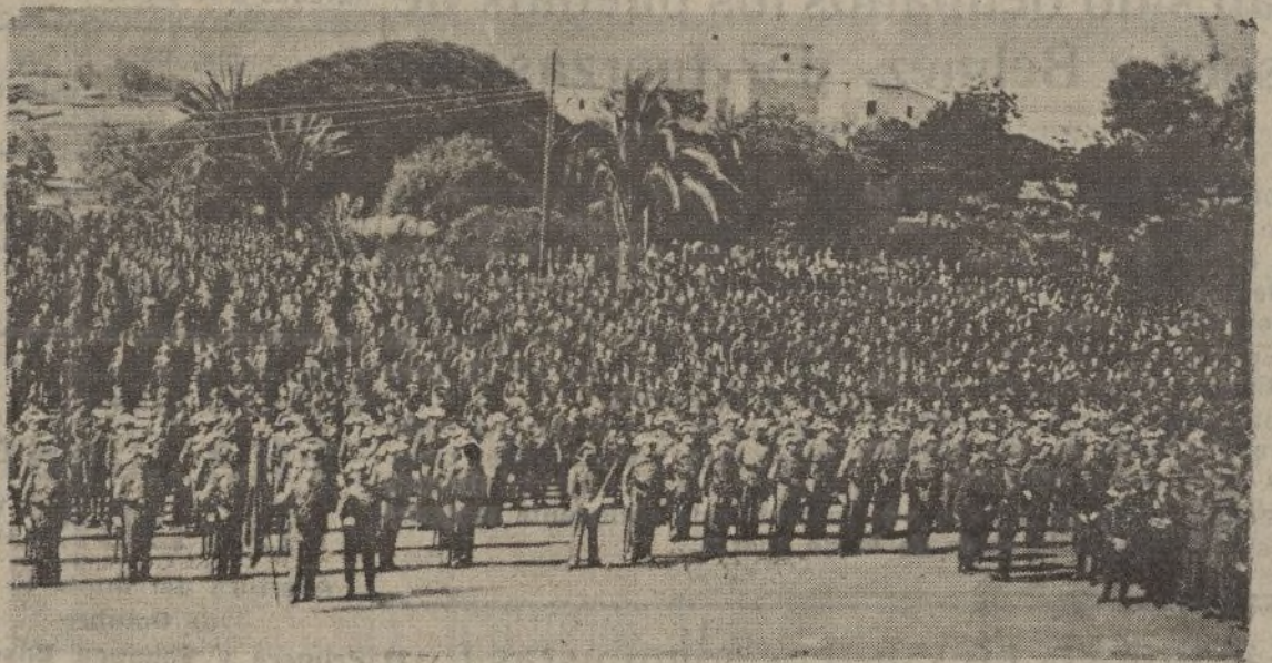
Una vista pncial de las fuerzas que asistieron a la concentración de Falange Española y misa de Campaña en La Rábida

Poco después, y también con los honores debidos, fueron traídas por falangistas, desde el Monasterio, las banderas de las Repúblicas americanas, con las de España, Huelva, Falange y la de algunas naciones extranjeras, entre éstas Italia, Portugal y Alemania. Dichas banderas con sus portadores se colocaron a lo largo de los peñañales de la es-