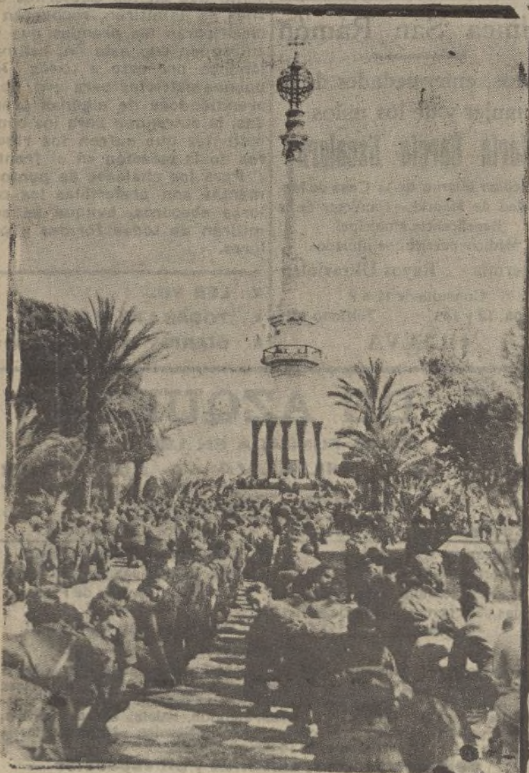
En el momento de alzar a Dios, las fuerzas rinden los honores debidos