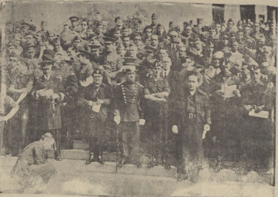
Las autoridades civiles y militares con los jefes de Falange presencian el desfile de las fuerzas en la concentración de Milicias de Falange, celebrada ayer en La Rábida.

El público aplaudió mucho a los falangistas a su paso por las calles del recorrido.