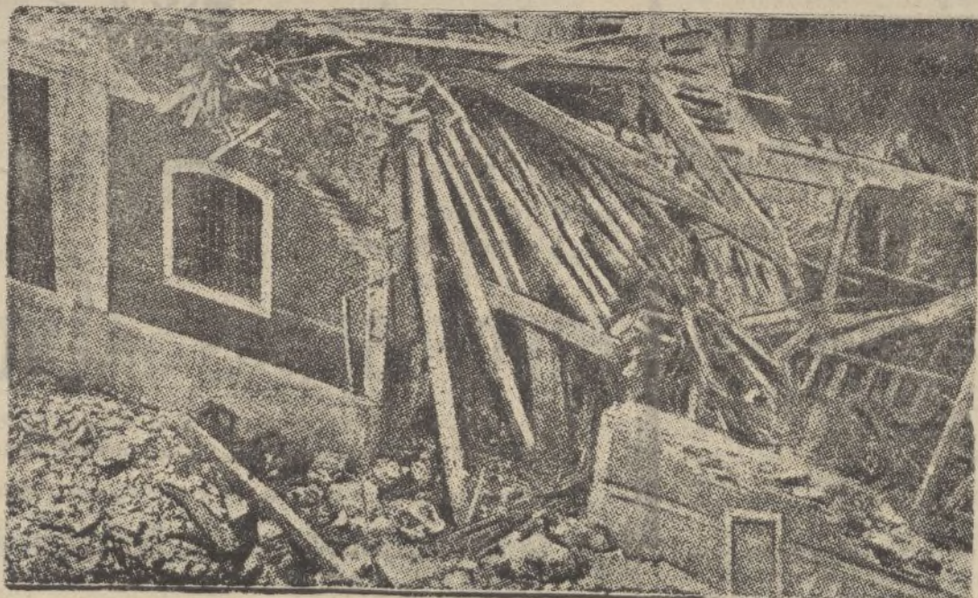
Los estragos causados en un cuartel de Madrid por una bomba arrojada por un aeroplano nacional

Horas de matrículas, de 6 a 8 de la noche.