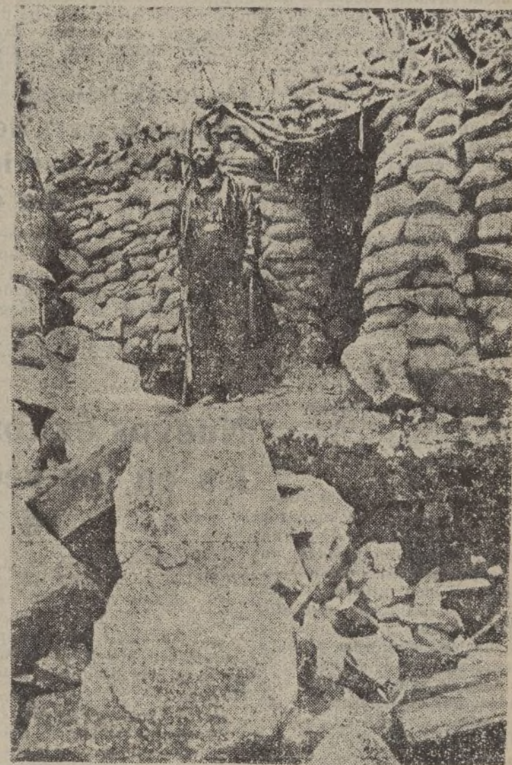
Un puesto avanzado de la Artillería en la sierra de Guadarrama.