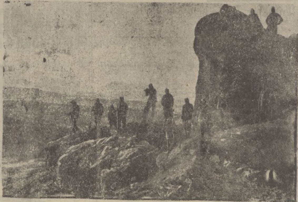
Un aspecto panorámico de la región de Navalperal, en donde se advierte lo accidentado del terreno en que luchan las fuerzas nacionales

DIARIO DE HUELVA se vende en Sevilla en calle Jimios