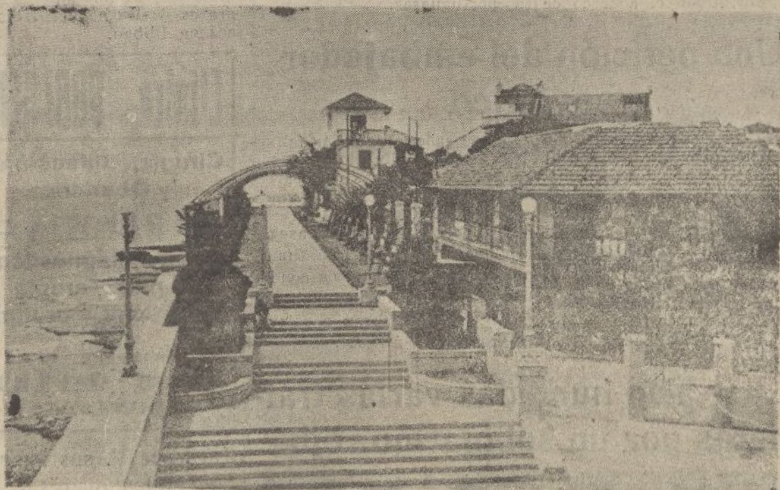
Paseo de las Bóvedas.—Entrada al Museo Nacional